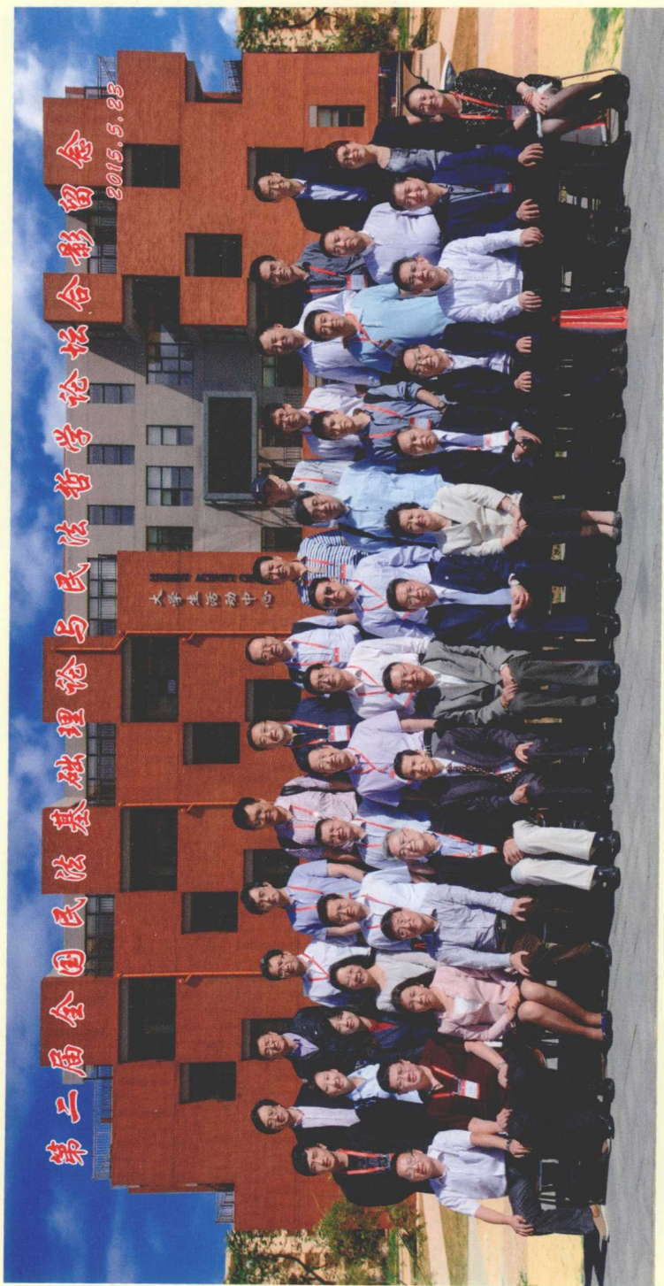
出席本届论坛的领导与嘉宾合影