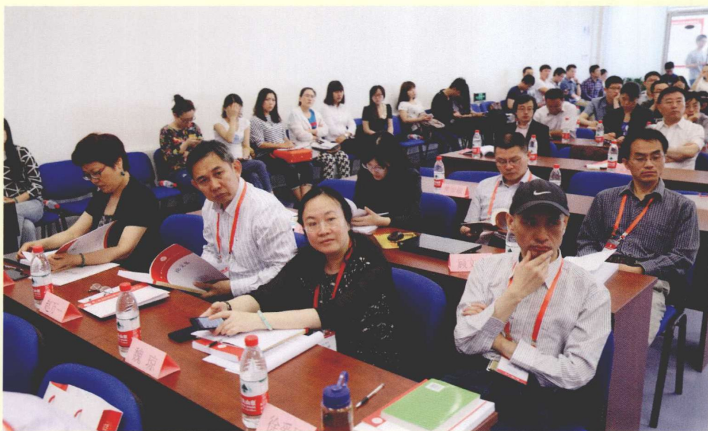
部分与会者在第一场“主题论坛”现场