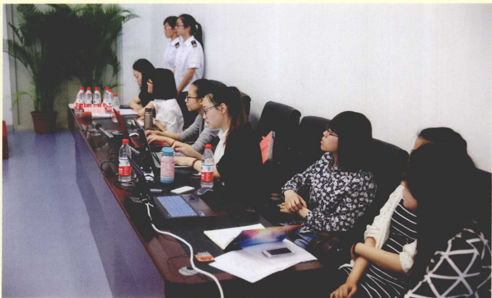
第一场“主题论坛”志愿者工作现场