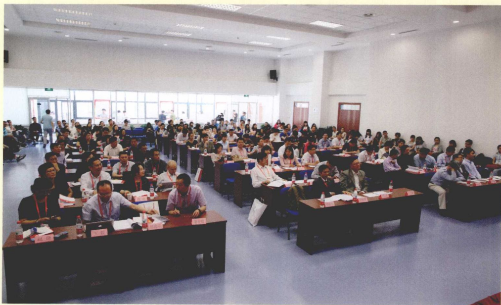
第一场“主题论坛”现场