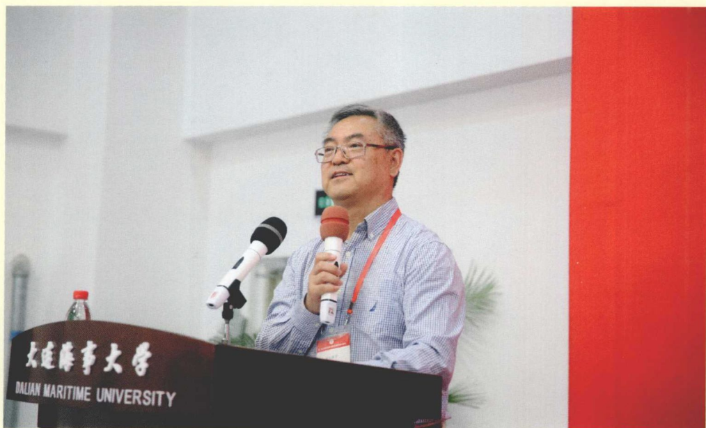
杨立新教授在第一场“主题论坛”上作主旨演讲