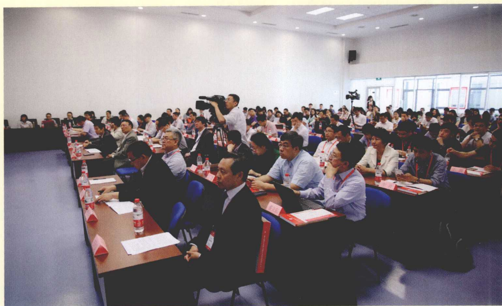
第一场“主题论坛”现场