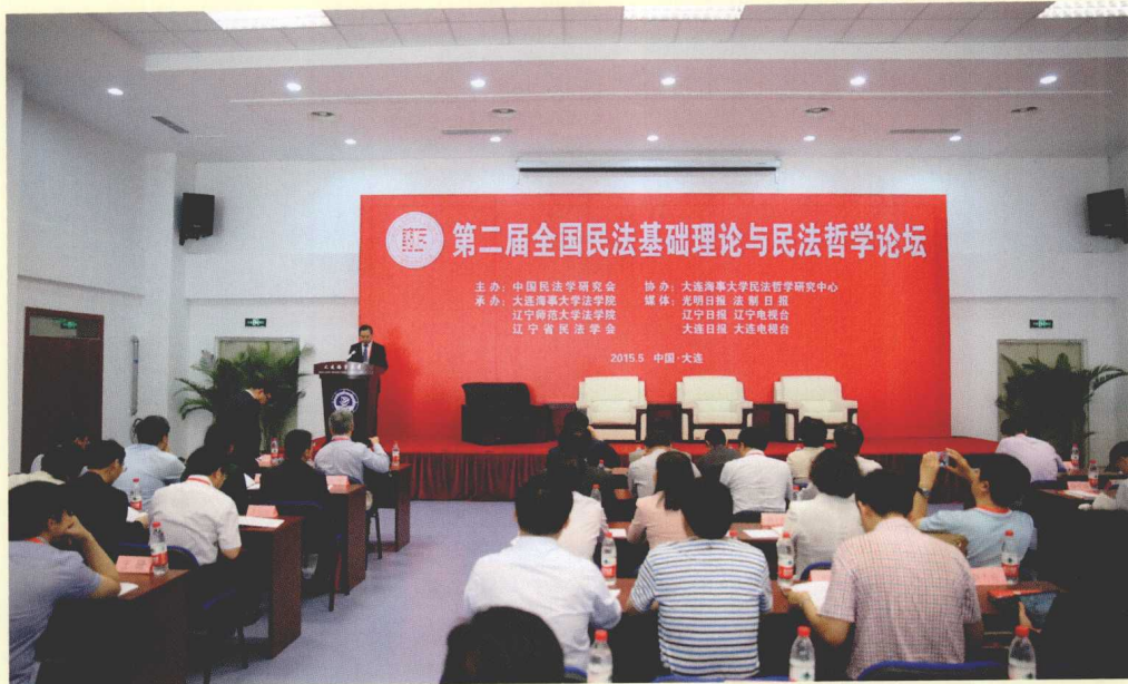
第一场“主题论坛”现场