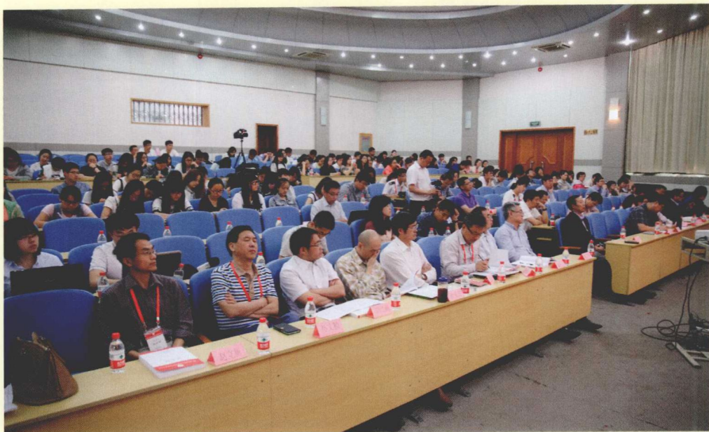
第二场“主题论坛”现场