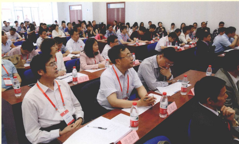
部分与会者在第一场“主题论坛”现场