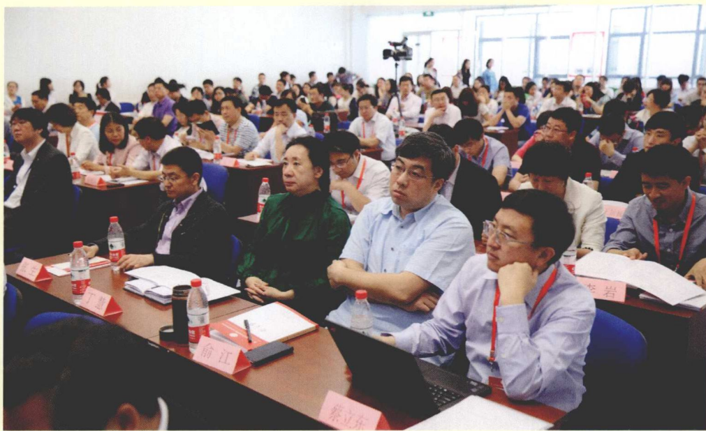
第一场“主题论坛”现场