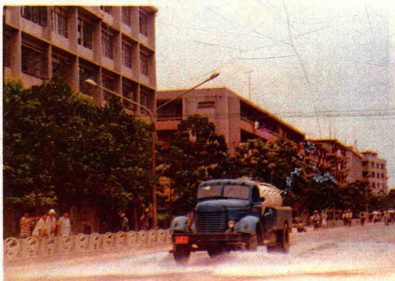
台城镇环卫处洒水车