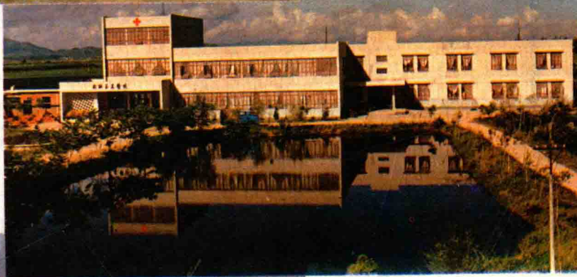
海宴港澳华侨医院