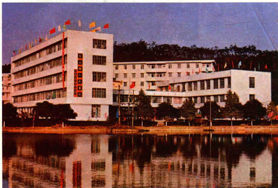
台山县人民医院