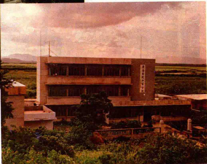
卫生所 广海医院山背