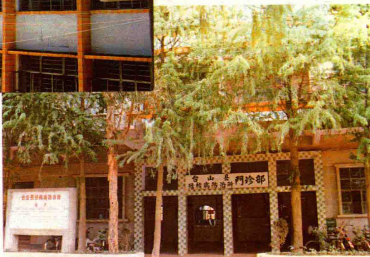
台山县结核病防治所