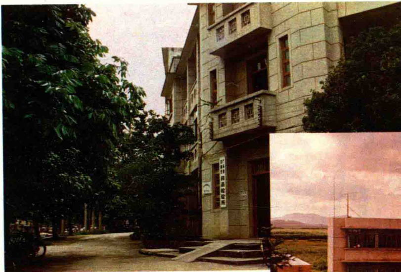
台山县药品检验所