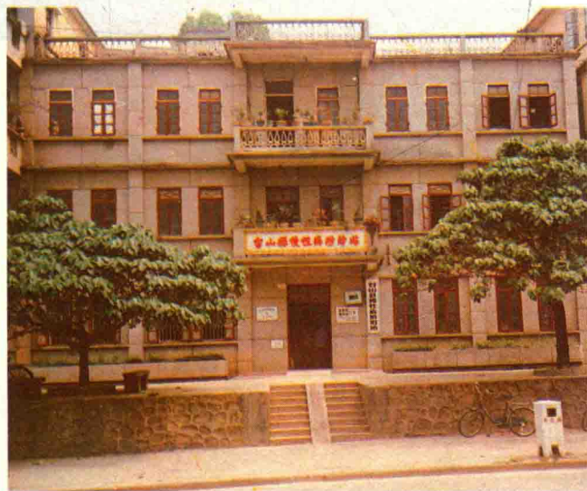
台山县慢性病防治站