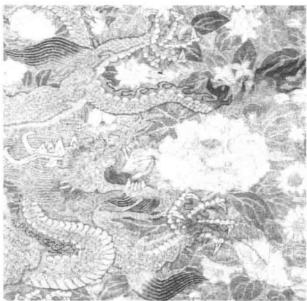
宋·缙丝百花攒龙纹包首图（局部）

训，安抚后周君臣，减少阻力，争取采用和平的手段完成政权移交。他随后向将士宣布，要求他们军纪严明，秋毫无犯，回开封后，对后周的太后和小皇帝不得侵犯，对后周的公卿不得欺凌，对朝市府库不得侵掠，服从命令者有赏，违反命令者族诛。将士唯唯听命。