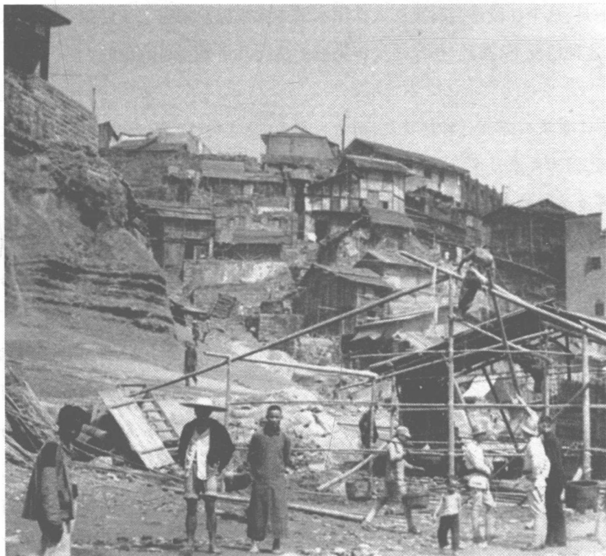
重庆居民修复轰炸遭毁房屋

较之沦陷区同胞,1945年生活在大后方的中国人多少要幸运一些,起码吃大米不算犯罪,而且也没经历过“共和面儿”的梦魇。吃喝拉撒四件事,说起来略显庸俗,然而对普通百姓来说,又件件都是性命攸关的大事。在1945年的陪都重庆,这“四件大事”中的后两件居然成了让老百姓头疼的难题。