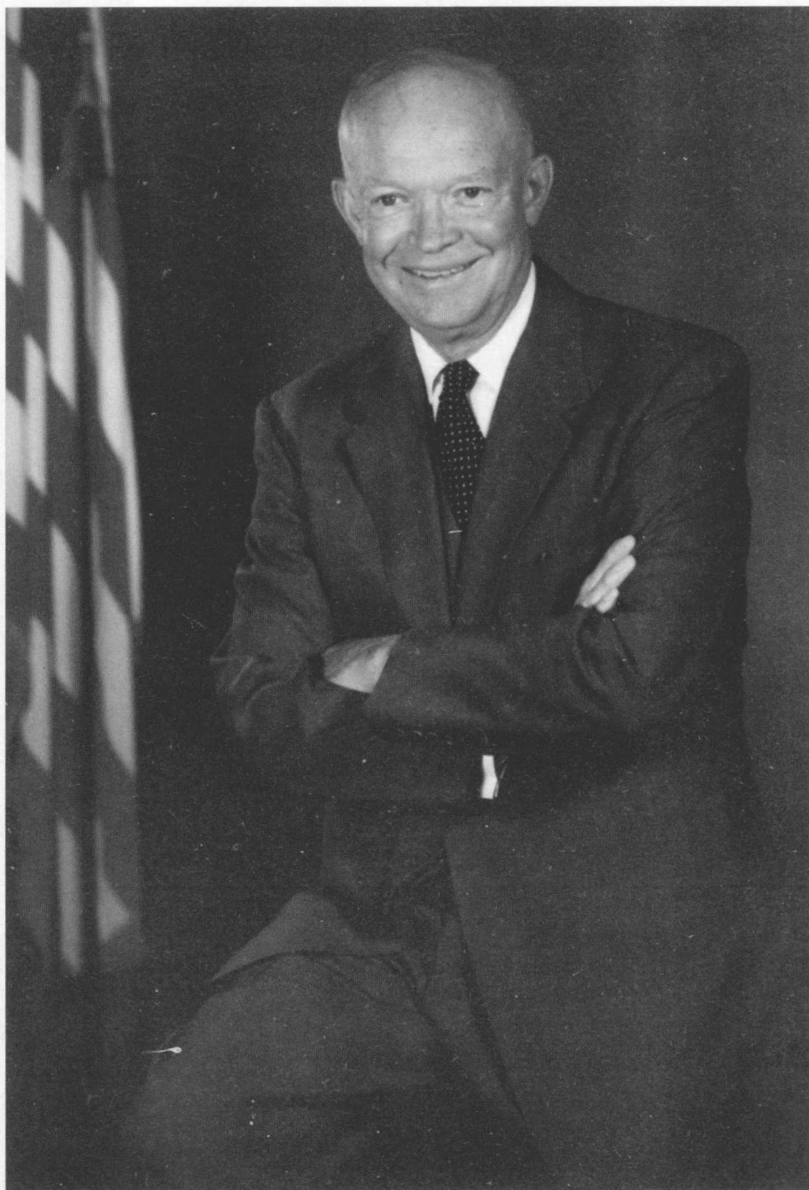
◎艾森豪威尔任美国第三十四届总统。