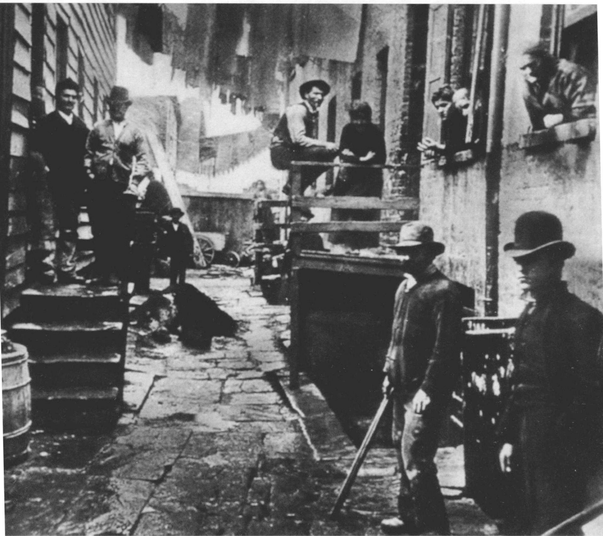
◎ 1890年10月14日，德怀特·艾森豪威尔的父亲戴维·艾森豪威尔，出生于美国得克萨斯州的丹尼尔森。他的双亲当时非常贫困，住在一栋简陋的木板屋里。而德怀特·艾森豪威尔也出生在这样的木板屋里。这是1888年，丹麦移民摄影家雅各布·瑞斯拍摄的贫民窟的照片。他的照片使公众开始关注城市贫民的绝望状况。