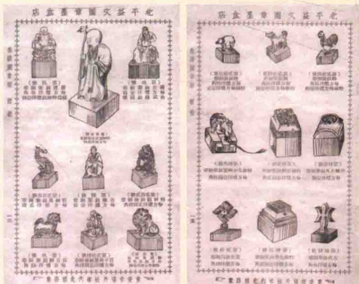
《金石翰墨雅集》中铜印钮样式