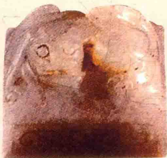
汉代玉质螭虎钮玉玺

历史的发展而发展的，印钮的造型也反映了不同历史时期的特定观念。战国以前多鼻钮，重实用不尚巧饰，缺乏变化。战国时期诸侯割据，七国称雄，故表现在印钮方面也丰富多彩，千姿百态，没有形成统一的规范。