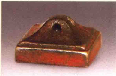
印钮的实用性及艺术性是随着 战国鼻形钮铜印

的追求及欣赏水平的提高，仅便于系带拿捏而不具观赏性的钮饰是不能满足人们审美需求的，于是很自然地将原有的钮饰不断加以美化，使之既有实用性又有艺术性。