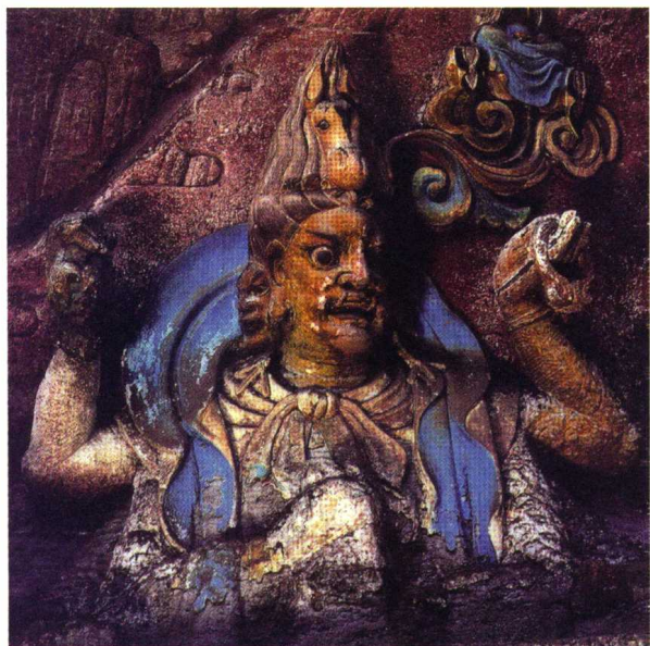
马头观音 四川大足石刻