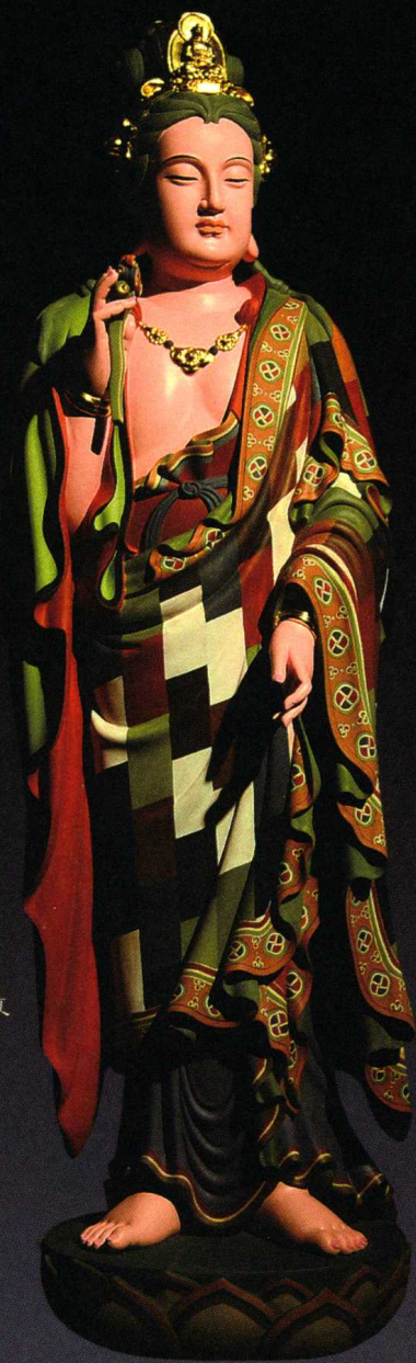
仿元代百纳衣观音 黄锦夏

爱的小马驹。到了公元1世纪前后，佛教徒考虑到其他菩萨都是人身，而观世音是畜身，太不相配，便将“马头观音”改为人身，于是观音菩萨就由畜身变成了一位长有胡子的男身丈夫形。四川大足石刻和敦煌莫高窟，均有马头观音的造像，佛教密宗中也有马头观音画像，观世音戴着一顶马头式宝冠，这是观音由马变人过程中的遗迹。