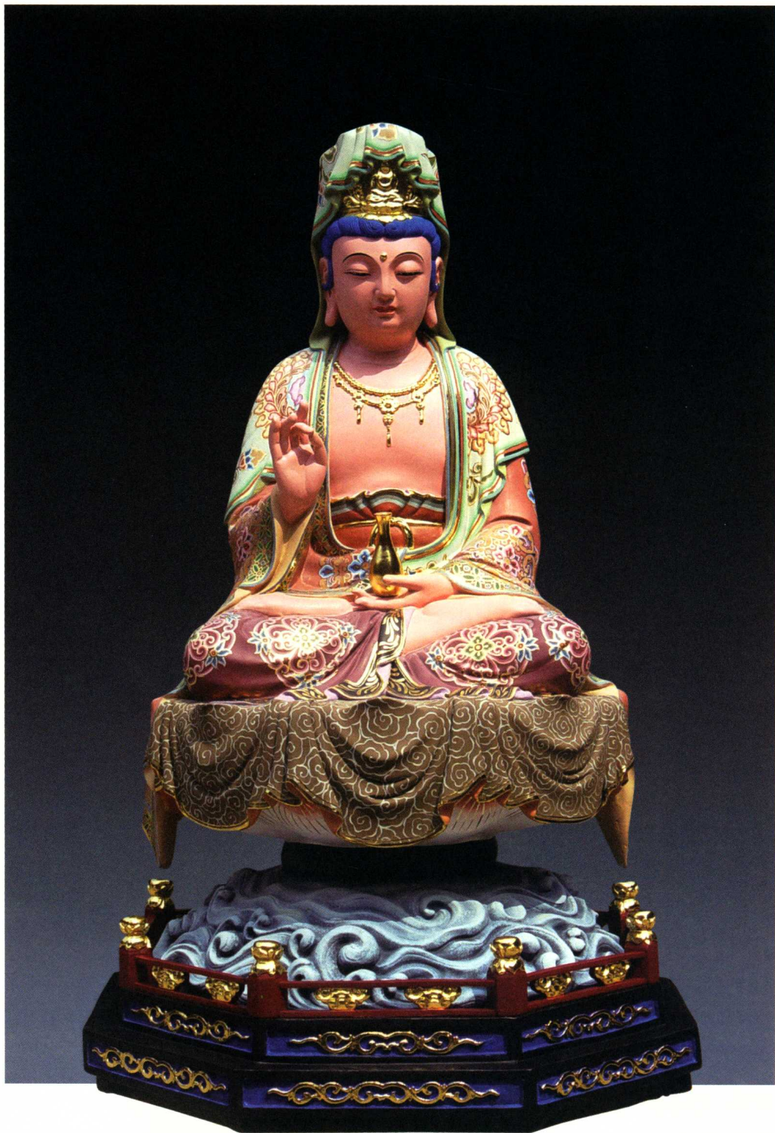
杨枝观音 浙江普陀山佛教协会赠送日本礼品 戚桂夏作