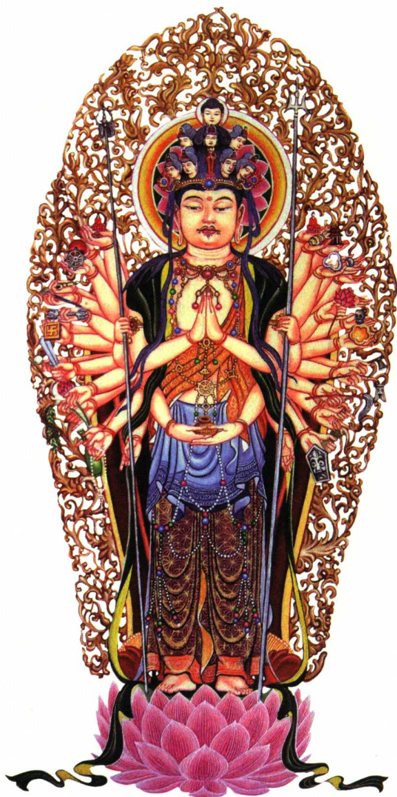
长着小胡子的男身观音

现在，人们看到的观音菩萨是一位端丽妙曼、宝相庄严的“东方圣母”，然而，观音菩萨最早的原型不是人，而是马。观音菩萨由畜变人，由大丈夫变成一位东方美妇，有一个漫长的演变过程。