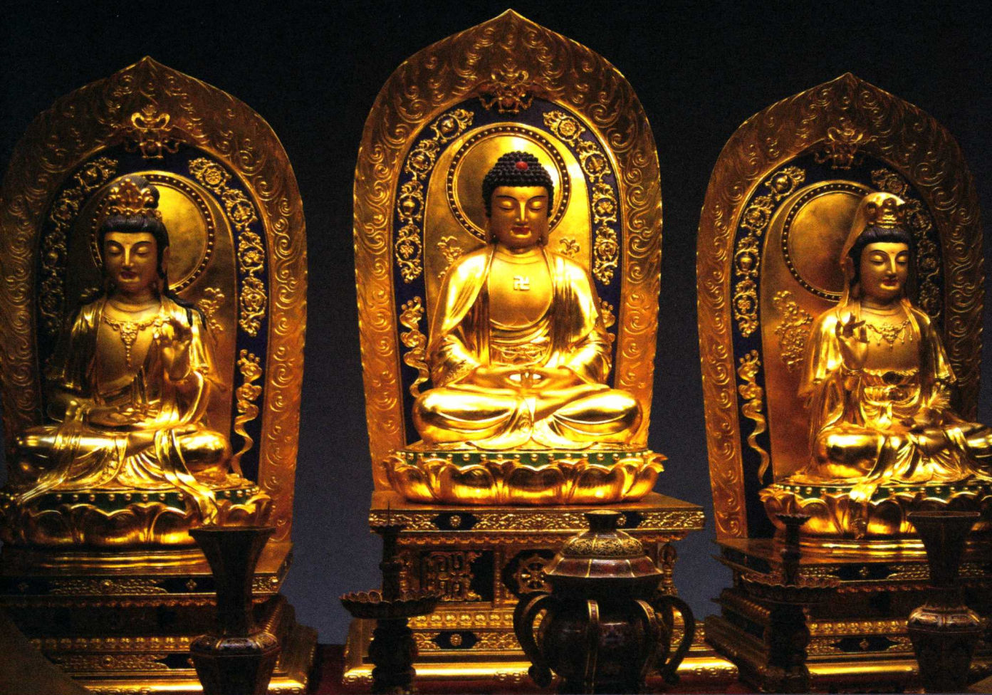
阿弥陀佛与左右两菩萨，右为观音，左为大势至。

观音，是西方极乐世界教主“阿弥陀佛”座下的上首菩萨，与阿弥陀佛和大势至菩萨一起，组成“西方三圣”。观音与阿弥陀佛有着特殊的关系，是阿弥陀佛的继承者，在民间的影响极为深远。千百年来，观音信仰遍布亚洲各国，甚至到达西方世界，其中以中国和印度最为普遍，从而形成了灿烂而独特的观音信仰文化。