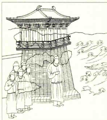
圖 1-8 唐永泰公主李仙蕙墓壁畫闕樓