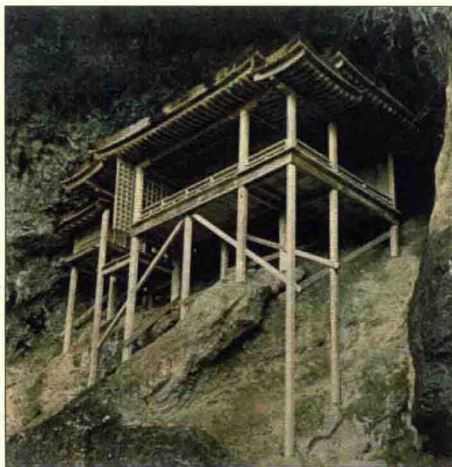
圖 1-5 鳥取縣三佛寺投入堂