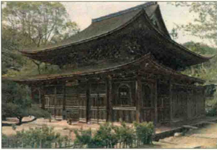
圖 1-1 功山寺佛殿