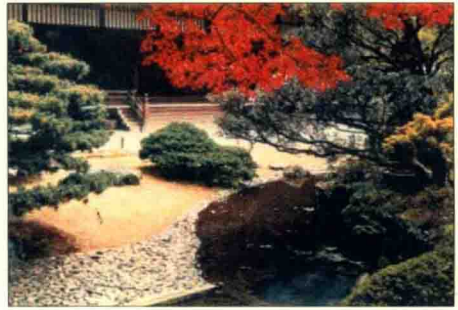
圖 1-2 日本京都御所之禪宗庭