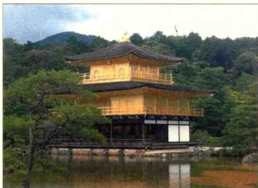
圖 1-9 京都鹿苑寺金閣