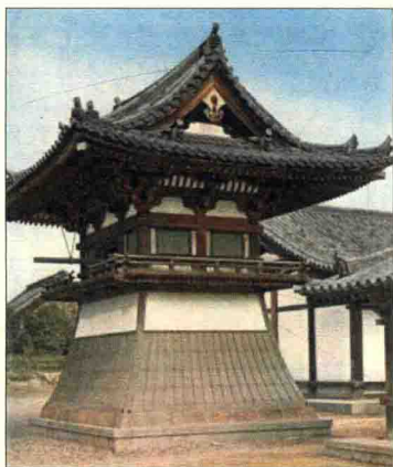
圖 1-7 法隆寺之東院鐘樓