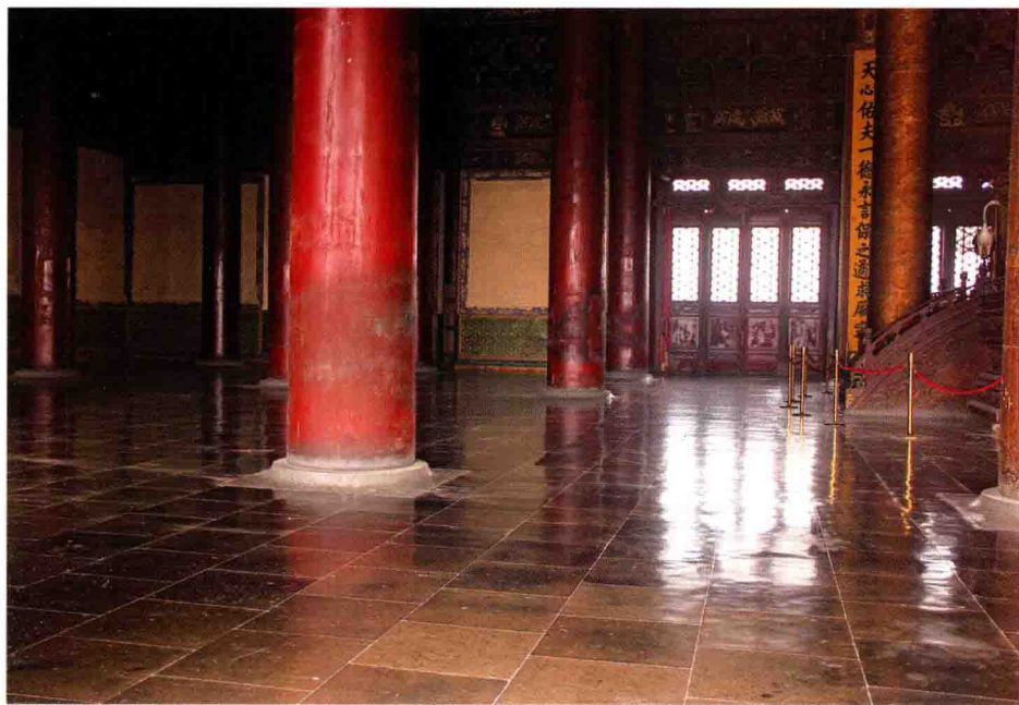
图4 太和殿的金砖地面

主宰天下的中心。紫禁城是北京城的中心，太和殿是皇宫的中心，太和殿里的宝座和座台又是太和殿的中心，太和殿的中心位置是在明间。太和殿面阔九间，进深五间，宝座及座台是在进深的中间一间，即第三间，座台上面对应的是屋顶藻井，宝座对应的是上悬的龙头宝珠，又称轩辕镜。但现在宝座的位置是进深的第四间。为什么会是这样呢？只是因为袁世凯窃国登帝前，因看到头悬宝珠，万一掉下来，岂不正着头额。袁世凯怕死于宝珠垂砸，而将宝座位置后移至第四进间。至于后果大家都明了和懂得的了，只是留下了短暂闹剧的遗迹（图5）。