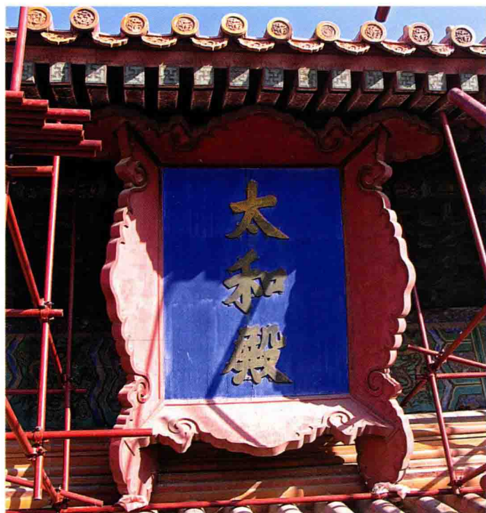
图6 2006年维修前的太和殿匾额