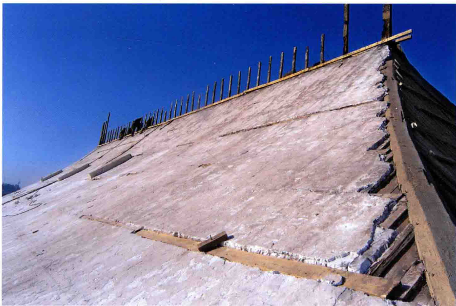
图3 太和殿屋面老灰背