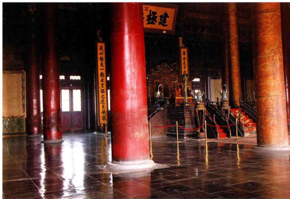
图5 太和殿内的宝座