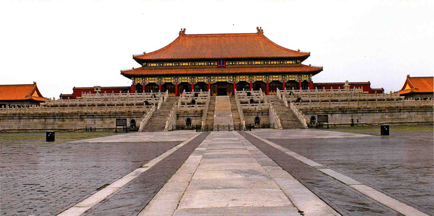
图7 维修之后的太和殿

识。对此，本书没有回答，我们也认为没有必要做回答。我们在这部作品中，只是尽量客观地反映维修中的事实。这样一座无与伦比的古代建筑代表作，不仅属于中华民族的，也是属于世界的，人们对它给予关心、评价，是非常自然的现象。其结果如何，或如何论定，不是本书要讨论的内容，更不是本书的目的。