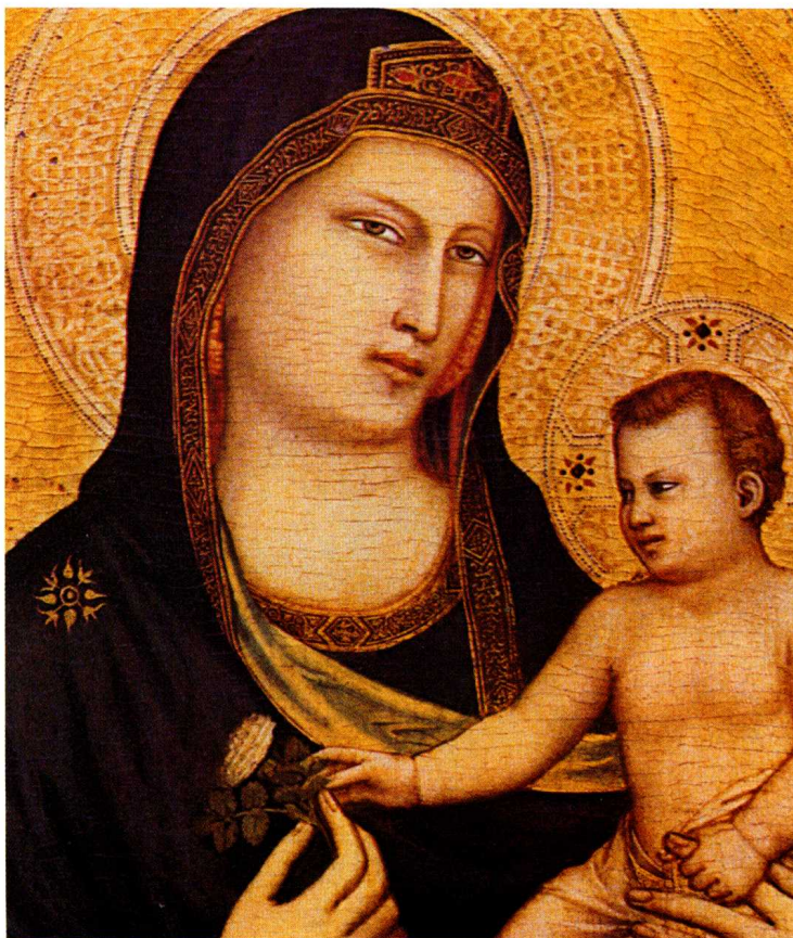
乔托,《带着圣婴的圣母》(局部), 1320—1330

它能够代表欧洲艺术的最高水平,从拜占庭时代到十八世纪末,但是现在目的对于他来说变得清楚了:即应该使尚不存在一座国家美术馆的华盛顿具有一个巨大的国家美术馆,以被人欣赏和被造访的伦敦国家美术馆为榜样。于是事情也就这样发生了,甚至可以说,这仅仅是开端。梅隆的珍贵收藏从这位大金融家的年轻时就已经开始,他为了它,进行了多次在欧洲的旅行,以便与那些最重要的古董商保持接触,并且实施购买,这些购买都被发现是属于最有威信的,这一切也要感谢他的朋友克莱·亨利·弗里克的鼓励与支持。作为古董商克诺德勒公司的热心顾客,他通过他们的中介作用,变成圣彼得堡修道院博物馆的二十一件杰出画作的产权所有者,当时这批艺术品的产权已转让给了亚美尼亚的亿万富翁古尔本金安。借助这种确实是轰动性的(它被视为拿破仑朝代以来的最大的打击)和在一九三〇年和一九三一年间结束在购买:拉斐尔的杰作如《圣乔治与龙》和《黎明圣母》,维罗奈塞的《摩西被发现》,弗朗德勒人凡·埃克的《天使报知》,桑德罗·波提切利的辉煌的《三王朝拜》,另外还有提香的几件作品,凡·戴克的四件作品和伦勃朗的五幅油画进