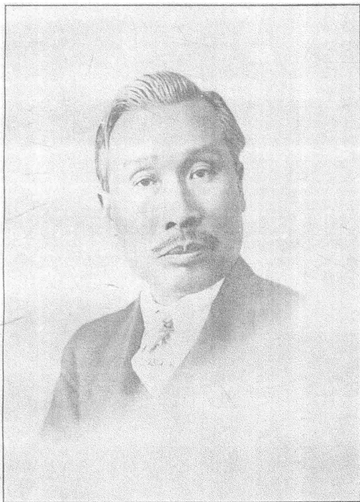
相我之年四十國民