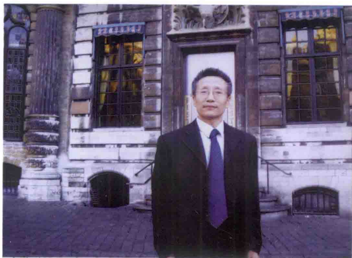
作者在天鹅咖啡馆前