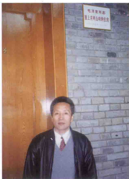
作者在江西省永新县毛泽东重上井冈山的住所前