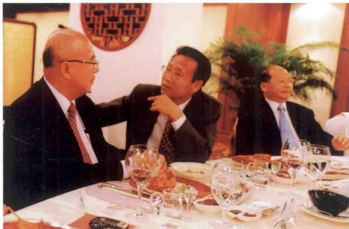
作者在国民党中央副主席林丰正主持的欢送晚宴上同国民党中央荣誉主席吴伯雄先生交谈