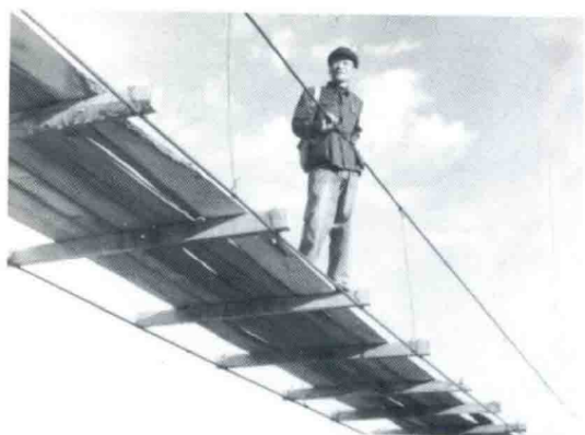
采风途中经过北江吊桥