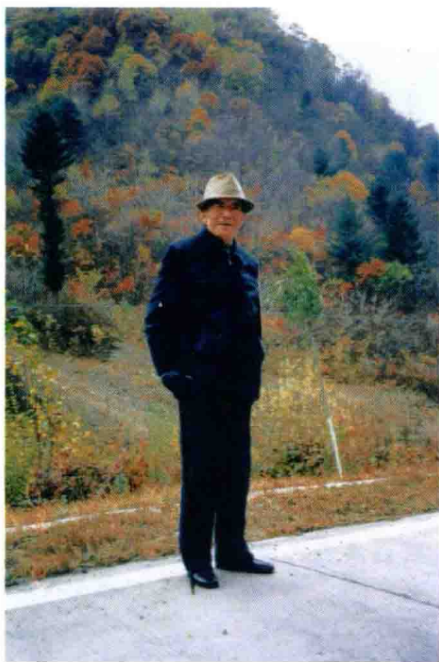
摄于抚松县城郊（二〇〇二年）