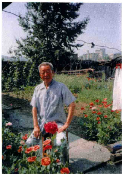
摄于家中（一九九〇年）