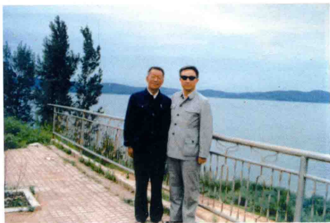
与原吉林省文化局副局长王也在海龙磨 盘山水库合影（1983年）。