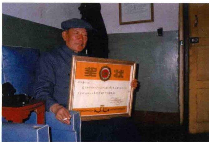
获省民间文艺家协会表彰（1985年）