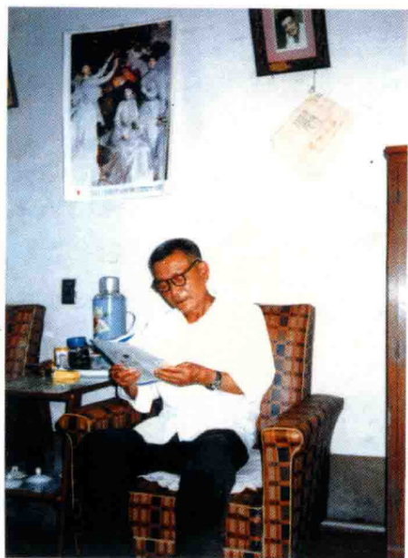
在家中看杂志（一九九一年）