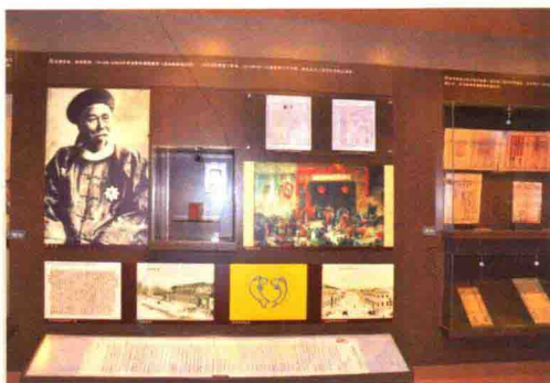
招商局创始阶段史料