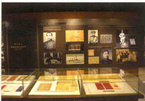
招商局艰难发展阶段史料