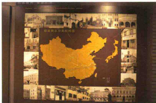
招商局扩张阶段史料