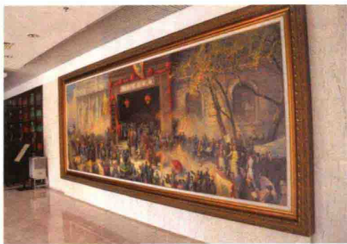
招商局刚刚开业的场景

然而晚清政府已经病入膏肓，回天乏术。孙中山先生领导的辛亥革命给封建专制制度以致命的一击。在战火纷飞的年代，招商局肩负起“与国家共命运”的历史使命。1912年，招商局临时股东大会同意将资产抵押借款给孙中山临时政府，以解财政的燃眉之急。1937年，卢沟桥事变后，日军南下进攻上海、南京，国民政府决定迁至重庆。当时，若日本军舰沿着长江水路快速西进，重庆也将危在旦夕。阻断长江航线已成当务之急，军队沿线狙击几乎没有胜算，沉船断流成了唯一的选择。在家国存亡之际，中国航运企业以自己的方式无比悲壮地展现了自己的爱国力量，这是一次殉葬，也是一种拯救。1937年至1939年间，招商局合计沉船18艘，共34520吨，占公司江海大轮总吨位的近1/2，有效阻挡了日军进攻的步伐；除沉船阻敌外，招商局还承担运送物资和军队的重任，支援抗战。1949年9月19日，招商局“海辽轮”自香港赴汕头应差途中起义。1950年1月15日，香港招商局及留港的13艘船舶近600名员工起义，并将13艘船舶全部驶返广州。新中国成立后，招商局从此回到了人民的手中，成为中国政府在港全资国有企业。