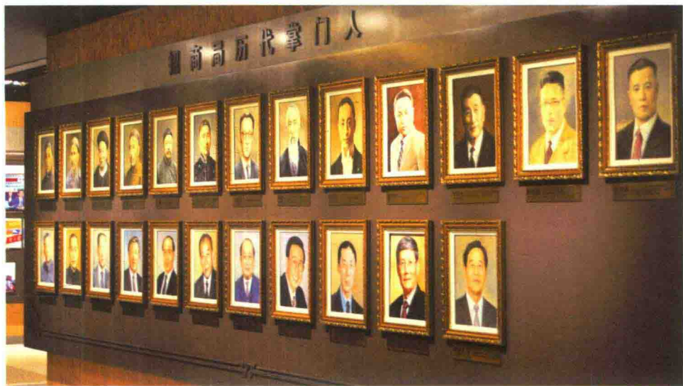
招商局历代掌门人

公司——仁和保险公司。慢慢地，招商局运作资本日渐丰盈，航线规模逐步拓展，在外国航运巨头前有了话语权。1877年，成立仅4年的招商局就以银现222万两一举并购了美国在华最大洋行旗昌洋行下属旗昌轮船公司的全部产业。同年，招商局与英国太古洋行、怡和洋行签订第一次齐价合同，中外公司在各条航线上共同议定统一的价格，确定水脚收入和货源分配方案。在充满屈辱和失败的时局下，这是中外商战中商难得的胜利，极大地振奋了人心。随后招商局开始在各地开设分局，开通国际航线，除了在航运业保持龙头地位以外，还积极投资其他产业，如开办了中国近代最早的大型煤矿开采企业——开平矿务局，试办中国近代第一家保税仓，创办中国近代第一家银行——中国通商银行，创建南洋公学（现上海交通大学前身）等。以招商局为代表的洋务运动推动了中国民族工商业的迅速发展，也为近代工业奠定了基础。