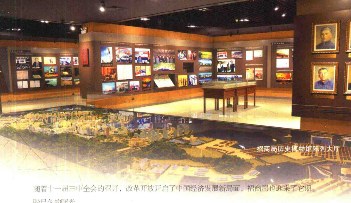
招商局历史博物馆陈列大厅

随着十一届三中全会的召开，改革开放开启了中国经济发展新局面，招商局也迎来了它期盼已久的曙光。