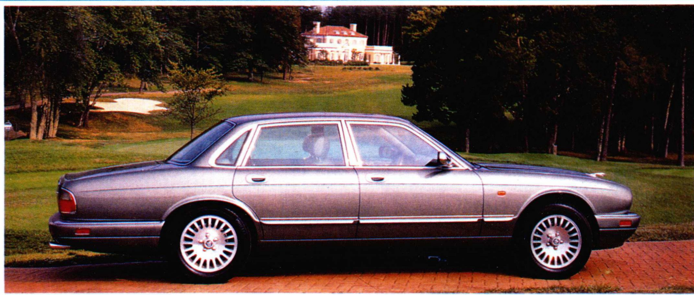
XJ-6 国内市场售价:545,000~562,000 元

这两款车于1990年面世以来,作为身份的象征。为了易于使人接受,全新美洲虎的复古味道便甚为浓厚。为了扩展顾客层面,厂方也出人意表的推出了这两款跑房车。(直列六缸V12引擎)