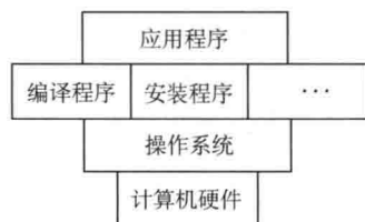
图 1-2 计算机系统的层次关系

操作系统是裸机上的第一层软件，是对硬件功能的首次扩充。引入操作系统的目的是：提供一个计算机用户与计算机硬件系统之间的接口，使计算机系统更易于使用；有效地控制和管理计算机系统中的各种硬件和软件资源，使之得到更有效的利用；合理地组织计算机系统的工作流程，以改善系统性能。