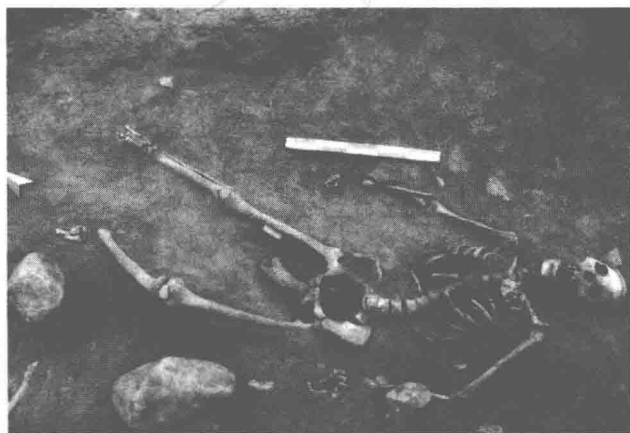
阴部被插入牛角的 受害女性