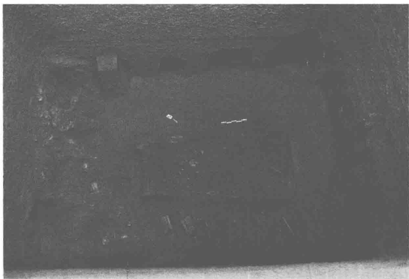
极尽考究的陶寺大墓，墓室与壁龛内遍布各类随葬品