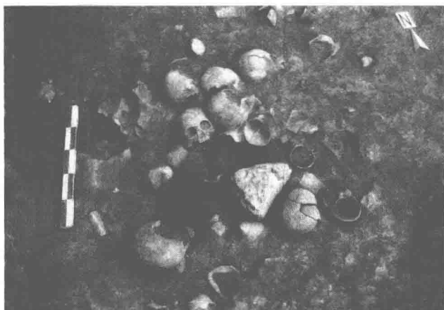
被砍切下的人头骨