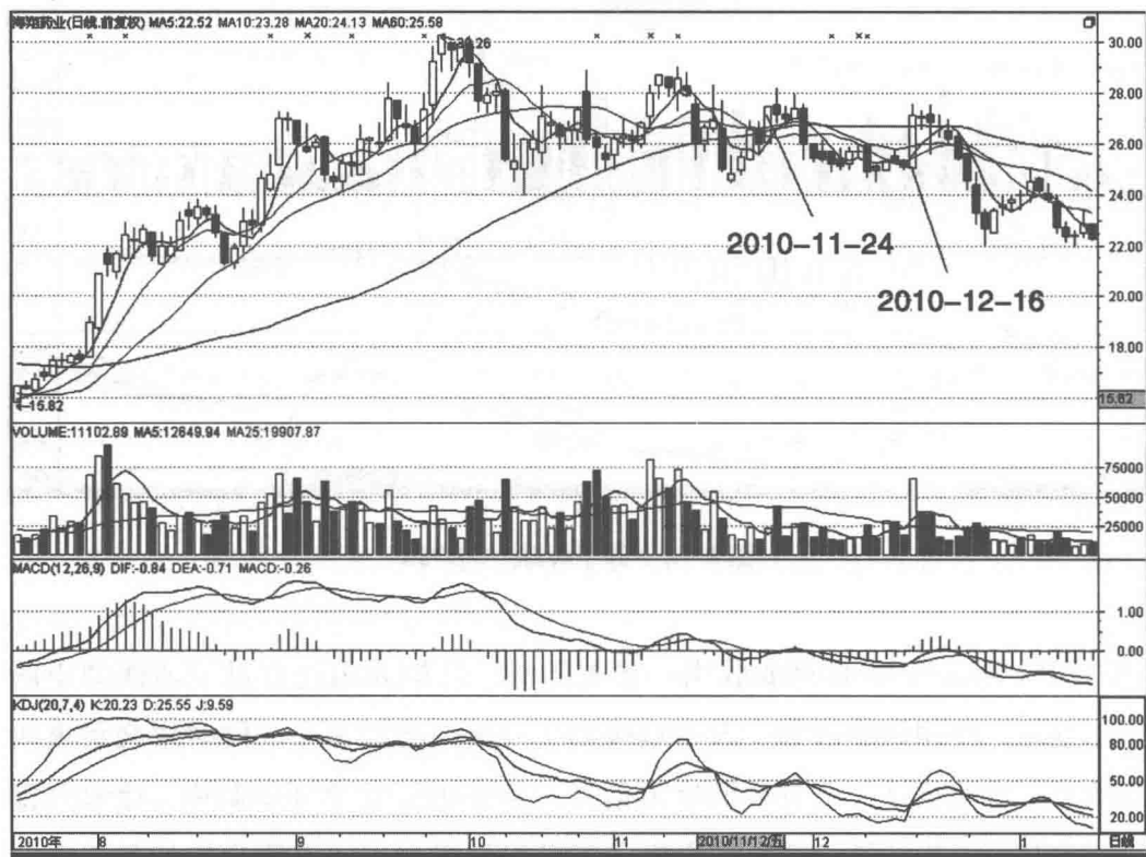
图 1-3 海翔药业 002099

浪比一浪高的上升趋势，右边则是一浪比一浪低的下跌趋势，这是很清楚了。也许你要说：“后面没发生的时候我怎么判定？事后诸葛亮谁不会！”这话在理。但是如果股价运行到2010年11月24日你还不知道走势已经呈现下跌趋势，那只能说明你对趋势的感觉比较麻木。后期的每一浪反弹都没欲望去挑战一下前高，就已经说明多头的孱弱。当反弹的高点一个比一个低的时候，我们就应该感觉下跌趋势正在形成。只是炒股的人多在心理上偏向美好的一面，以至于总认为调整之后还会有更大的涨幅，这种心理害死了不少人。