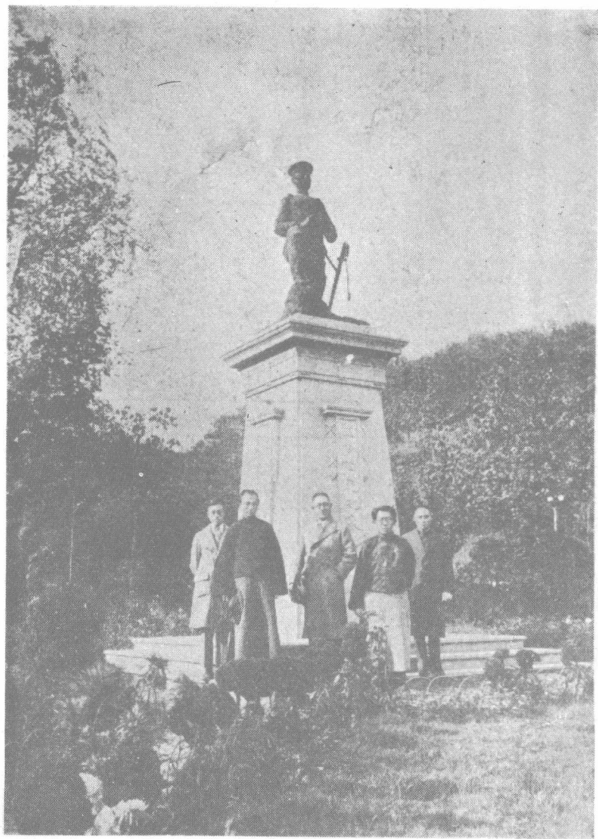
弟介希志羅三墨顧之敬何偕年一十二 影合園公先伯江鎮在生先四夫立