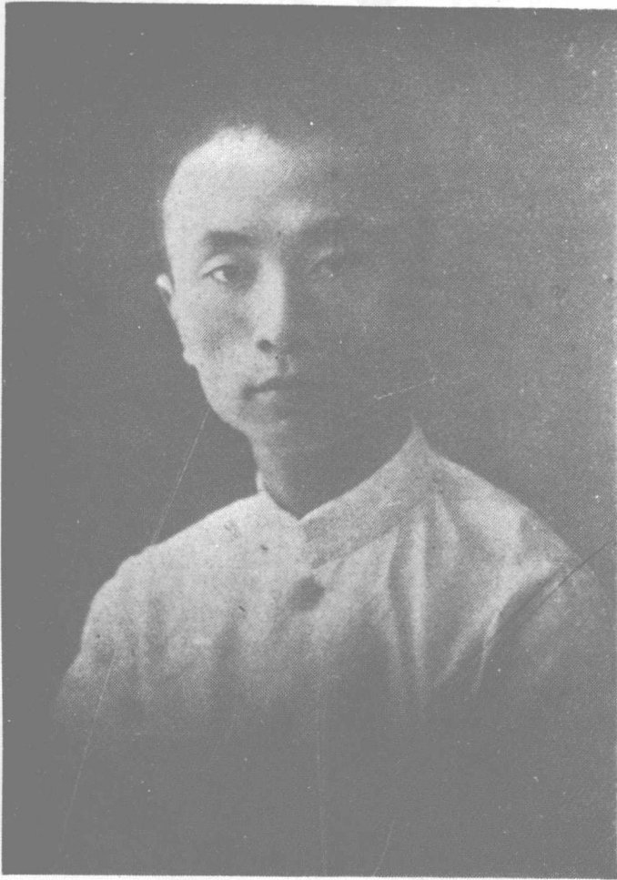
代 時 年 青