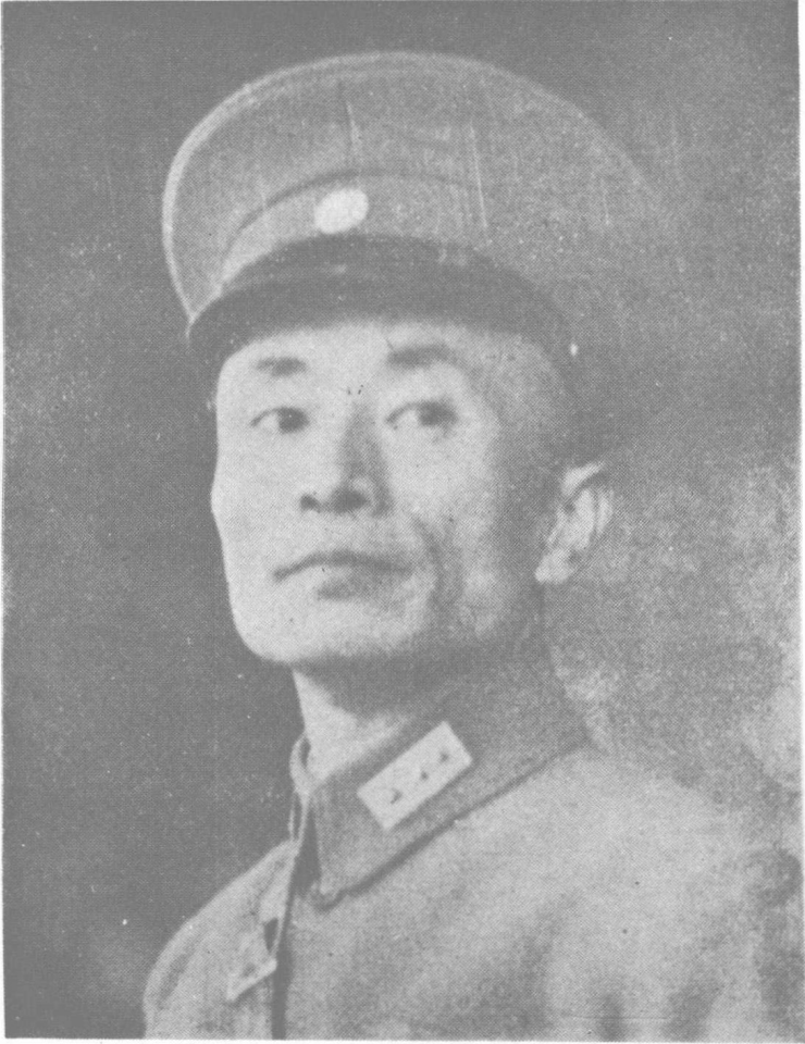
內任令司安保省全兼席主府政省蘇江在