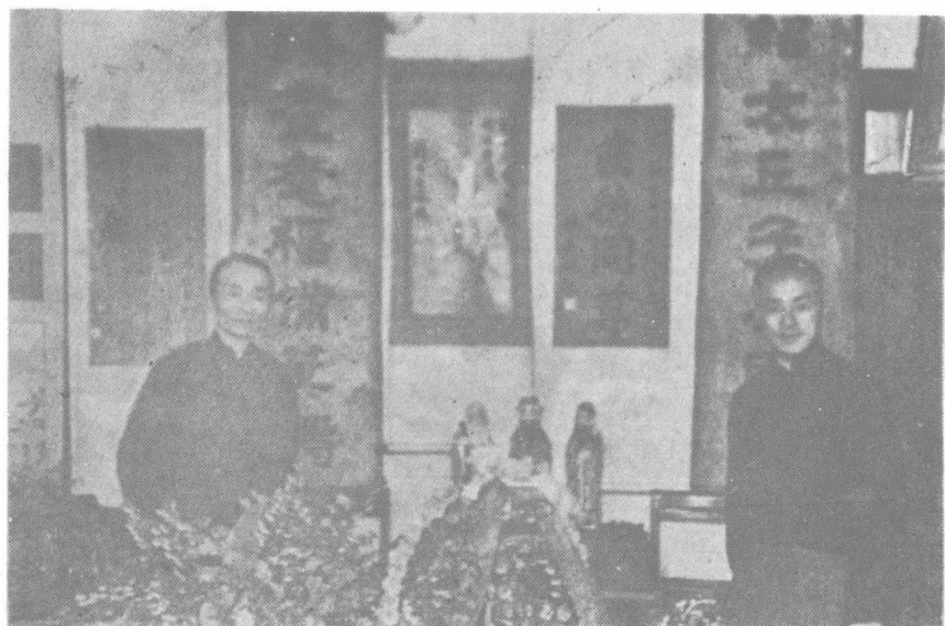
攝時辰誕十七生先士勤翁封年九十二