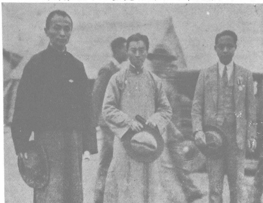
影合生先先驩朱生先夫立弟介與