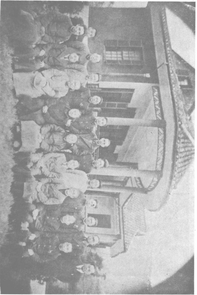
影合舊故志同與衆溫小縣巴在日三月一年十三