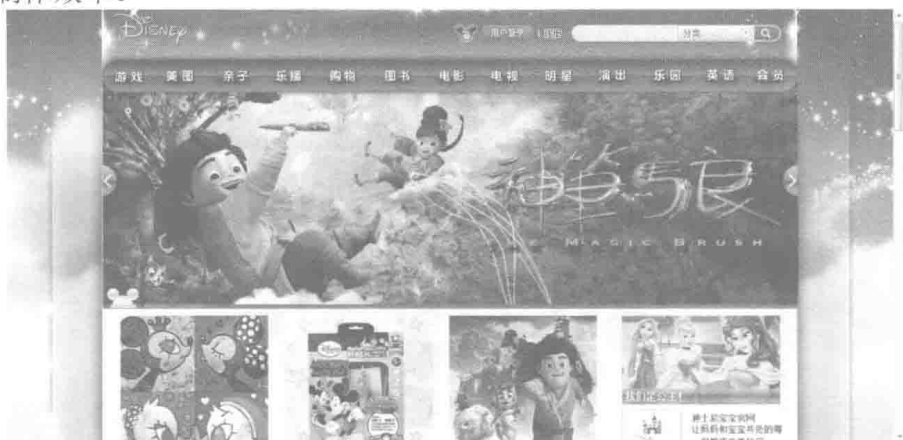
图 1-13 迪士尼中国官网首页

一个网站由多个网页构成。在制作网页的时候，往往先把大的结构设计好，然后再不断完善小的结构设计。网页数量众多时，在制作网页的时候可以灵活运用模板和库来提高网页制作效率。