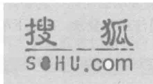
图 1-11 搜狐网站 Logo

标志可以是中文、英文字母，也可以是符号、图案等。标志的设计创意应当与网站的名称和内容相符。在网站 Logo 设计中要有基本的 Logo 特征，符合 Logo 设计基础，适合在不同的风格显示器下的效果、清晰度以及最小尺寸。如图 1-11 所示是搜狐网站的 Logo。