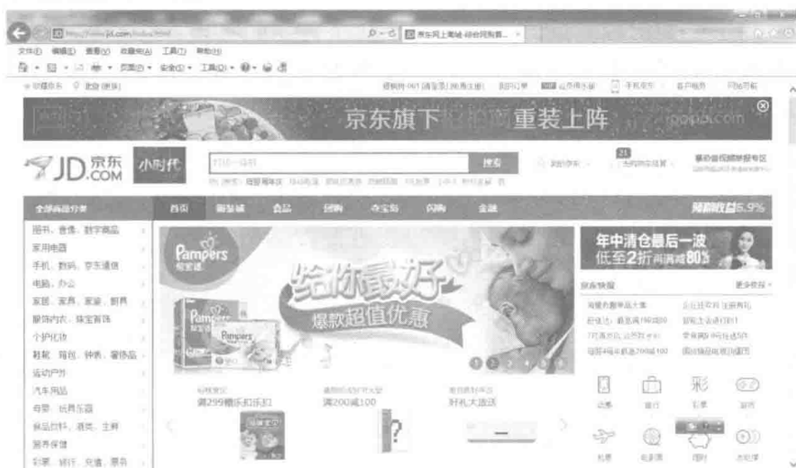
图 1-2 京东商城的主页

(5) 静态网页没有数据库的支持，在网站制作和维护方面工作量较大，因此当网站信息量很大时完全依靠静态网页制作方式比较困难；