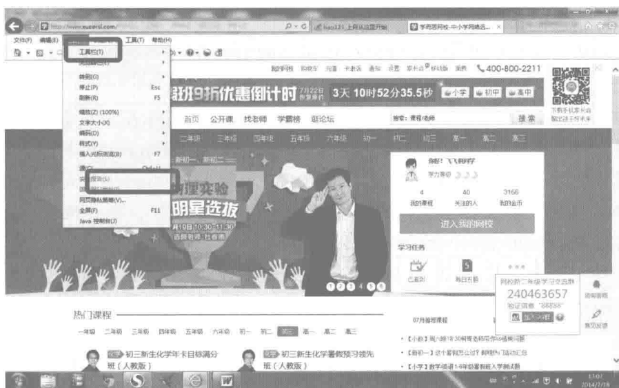
图 1-5 “查看”菜单