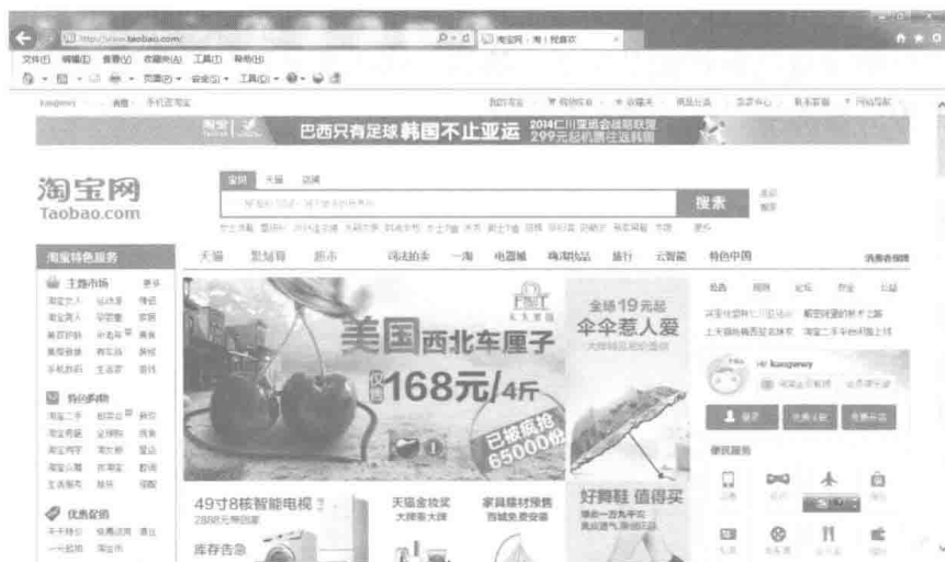
图 1-1 淘宝网主页

一个网站通常会由多张网页组成，分别称为主页和子网页。一般主页给浏览者的印象最为深刻，因此主页的设计效果好坏就显得至关重要。图 1-1 所示为淘宝网的主页，网址是 http://www.taobao.com ，是一个典型的购物网站，主页内容丰富，方便买家购买商品。