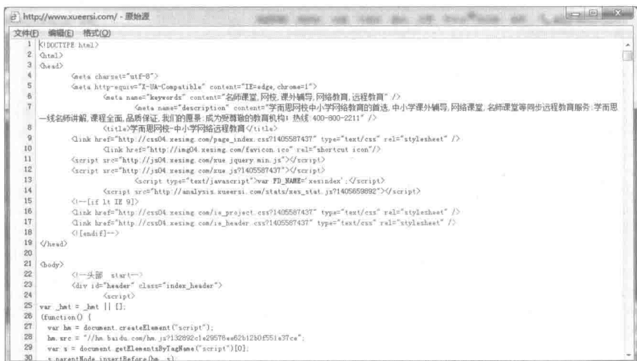
图 1-6 学而思网校主页 HTML 代码