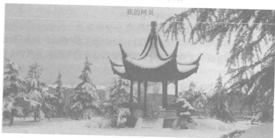
图 1-9 IE 浏览器显示的网页效果