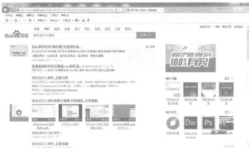
图 1-3 百度搜索结果网页

http://www.baidu.com/?isidx=1#wd=%E7%BD%91%E9%A1%B5%E8%AE%BE%E8%AE%A1%E4%B8%8E%E5%88%B6%E4%BD%9C&rsv_spt=1&issp=1&rsv_bp=0&ie=utf-8&tn=baiduhome_pg&rsv_sug3=4&rsv_sug4=124&rsv_sug1=3&rsv_sug2=0&inputT=4381