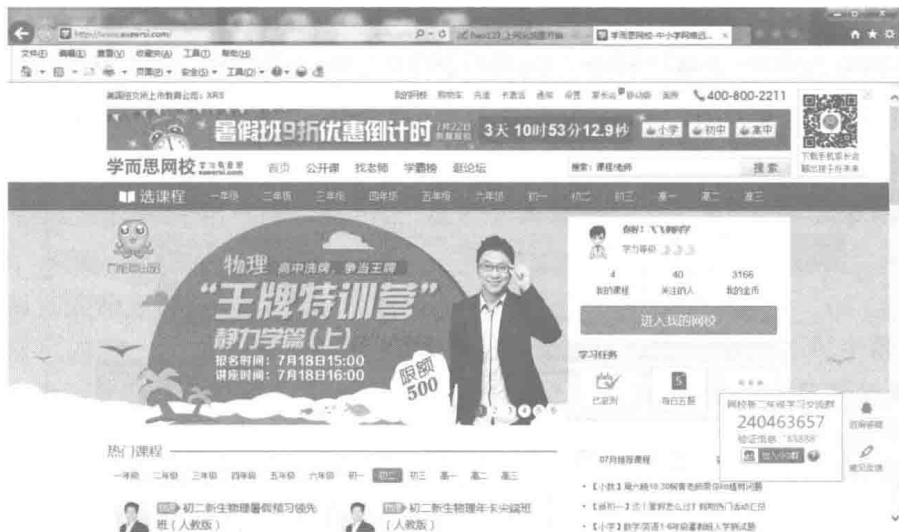
图 1-4 学而思网校首页

自从 1990 年以来，HTML 就一直被用作 WWW (World Wide Web) 的信息表示语言，用于描述网页的格式设计和与其他网页的链接信息。使用 HTML 语言描述的文件，需要通过 WWW 浏览器显示出效果 (如图 1-4 所示)。我们可以在浏览器窗口中选择“查看”→“源”命令 (如图 1-5 所示)，弹出一个 IE 自带的查看工具，可以看到网页的源文件就是由一行行代码组成，这些就是 HTML 代码 (如图 1-6 所示)。