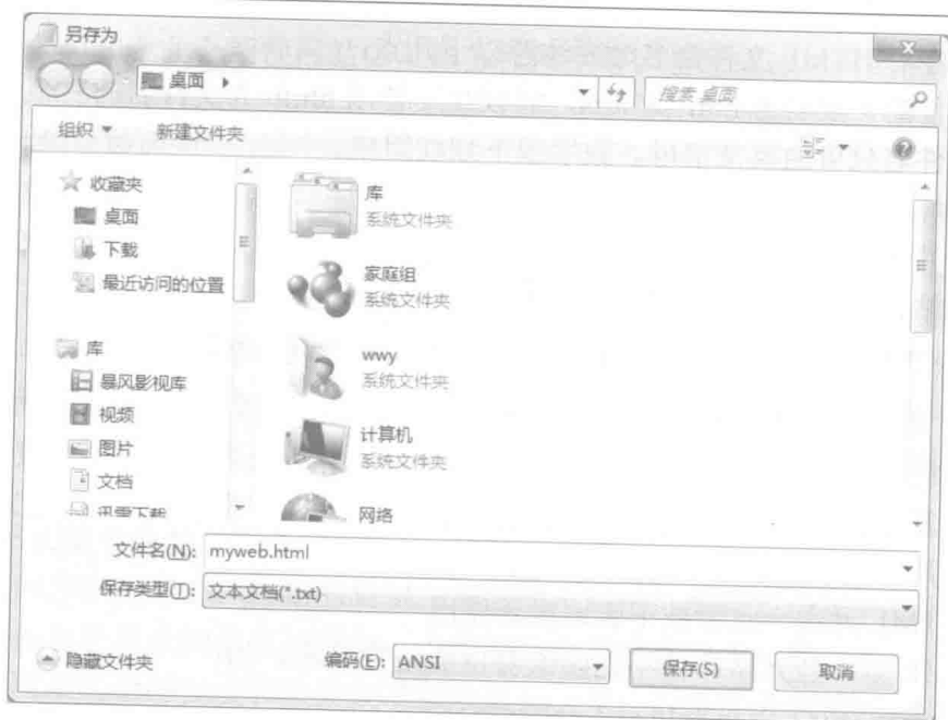
图 1-8 保存为 web 文件