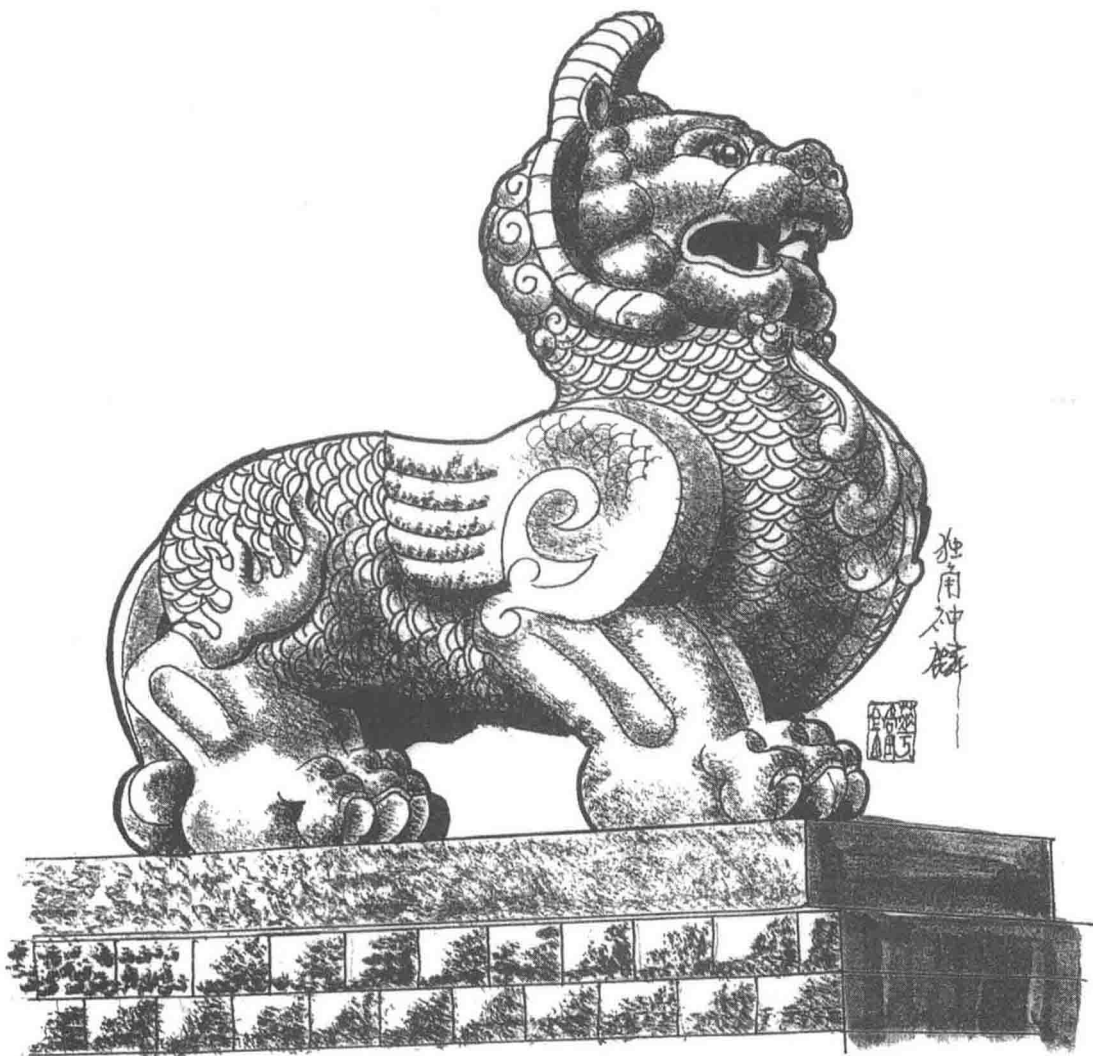
图 1-3 独角神麟