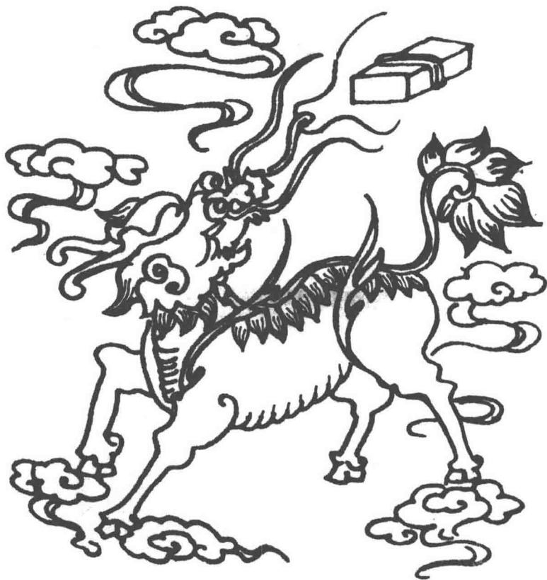
图 1-5 石雕“麟吐玉书”

(见《陈书·徐陵传》)。唐朝诗人杜甫也在《杜工部草堂诗笺·徐卿二子歌》中对徐陵的两个儿子称赞为“麒麟儿”：“君不见徐卿二子生奇绝，感应吉梦相追随，孔子释氏亲抱送，并是天上麒麟儿。”人们还以“麟子凤雏”比喻贵族子孙；以“麟趾”祝颂子孙贤惠；以“麟趾呈祥”作为结婚吉联的横批，祝颂生育仁厚的后代；以“麟肝凤髓”比喻极为稀有的食品；以“麟角凤嘴”“凤毛麟角”说明物品的罕见、珍贵。