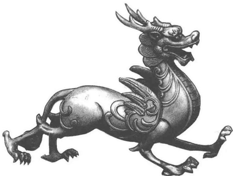
图 1-1 中国麒麟文化之乡—— 巨野旅游标志之一

首在哪里？孔子如此重视麒麟，弟子们不理解这是为什么，孔子解释说，麒麟的出现是天下太平盛世的征兆，可是麒麟刚刚出现，就被扼杀，使孔子痛惜不已，他联想到自己一生怀才不遇，触景生悲，为麒麟写下一首挽歌：“唐虞世兮麟凤游，今非其时来何求，麟兮麟兮我心忧。”从此孔子绝笔，不再著书。