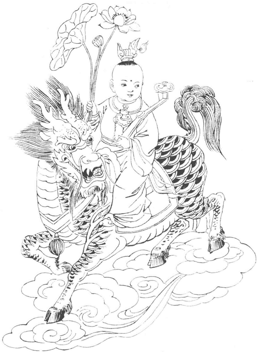
图 1-4 麒麟送子