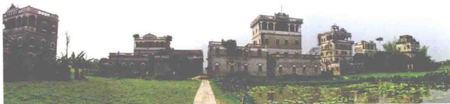
图1-2 开平市塘口镇自立村碉楼群（2004年）