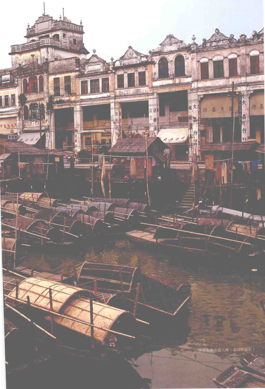
平平市赤坎镇古埠