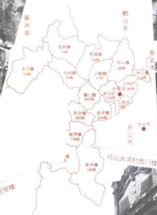
塘口流安村天恩楼