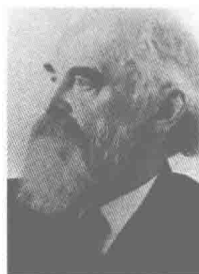
图 1-1 德国社会学家 F. 滕尼斯(1855~1936 年)

最早在社会学的研究上使用“社区”这个概念的是德国社会学家 F. 滕尼斯(图 1-1)。1887 年，滕尼斯出版社会学名著 Gemeinschaft und Gesellschaft ，此书被译成英文时名为 Community and Society ，20 世纪 30 年代我国社会学家将其译为《社区与社会》。滕尼斯认为， Gemeinschaft (即社区)一词表示一种由具有共同习俗和价值观念的同质人口所组成的关系密切、守望相助、存在一种富有人情味的社会关系的社会团体；人们加入这一团体，并不是根据自己的意志所做的选择，而是因为他生长在这个团体。与此相应，他认为 Gesellschaft (即社会)一词则表示一种由具有不同价值观念的异质人口所组成的、由分工和契约决定的、重理性而不重人情的社会关系的团体；人们加入这一团体是根据自己的意志进行选择的结果。可见，滕尼斯在提出“社区”这一概念时，强调的是社会共同体、团体，并没有特别强调其地域性。