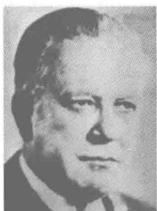
图 1-2 罗伯特·帕克 (1864~1944 年)

度地与他们生存的土地有密切关系；三是生活在其中的每个人处于一种相互依赖的互动关系。”帕克强调了地域、一定数量的人口和互动性关系网络这三个方面。由此开始，地域成为社区概念中必不可少的要素，围绕社区的讨论都要以一定的空间区域为基础，这可以视为对社区概念最重要的一种完善。