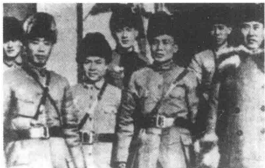
参加绥远抗战的中国军人

后来，我随部队参加了百灵庙战斗 ① 。当时包头饭店是日本特务机关的一个据点，为了不被敌人察觉，部队以两团对抗搞军事演习为名，全副武装离开包头，出城北走。我们向北走呀走，天黑了还在走，当兵的觉得这和平时演习不太一样，连排长们也不知道是怎么回事。第二天部队到达固阳，晚上一个士兵发一个急救包，长官要我们吃完饭开始擦枪擦子弹，然后好好睡一觉，看来是真格要打了，我心里毛毛的。这一仗打得真漂亮，拂晓开始攻击，出其不意