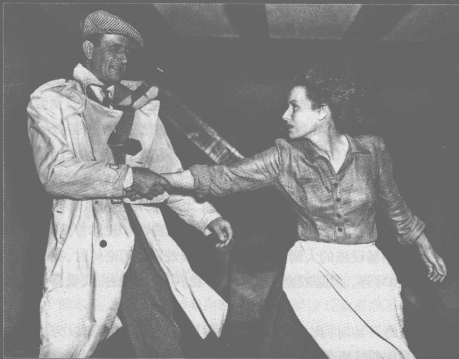
《蓬门今始为君开》(The Quiet Man, 1952)