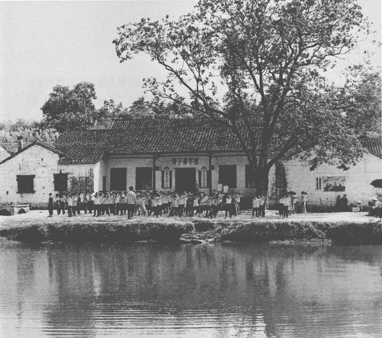
▲ 刘少奇读私塾的旧址

(云庭)，三哥刘绍达（作衡），大姐刘绍德，二姐刘绍懿。八岁那年，父亲把他送到邻村柘木冲私塾读书，读的是《三字经》《千字文》《论语》等。第二年，他又换到罗家塘私塾读书，开始读《大学》《中庸》《孟子》等。由于学费等原因，他不得不经常变换学堂，从10岁到13岁，先后在月塘湾、洪家大屋、红米冲、花子塘等地的私塾读书，差不多一年换一个地方。其中，洪家大屋私塾的读书环境和教学方法给刘少奇留下了深刻印象。这个洪姓没落的封建官僚家庭，为了使幼子受到很好的教育，专门选聘了一位上过师范学堂的先生杨毓群，到家中开设教馆，并招收少量功课好的邻家子弟伴读。由于刘少奇品学兼优，又与洪家的幼子同龄，故免交学费。刘少奇在这里学习国文、算