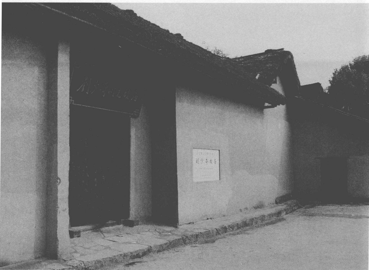
▲ 刘少奇在这里诞生