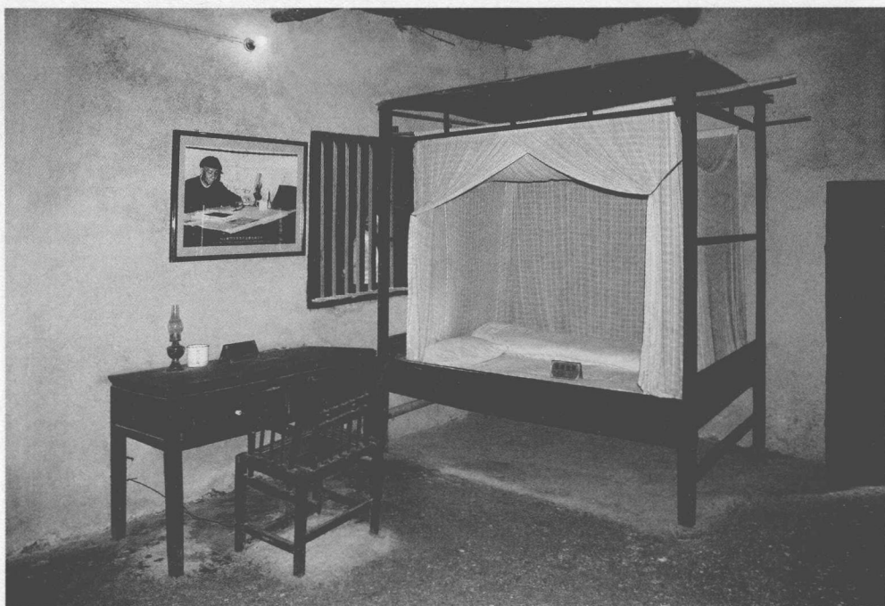
② 刘少奇青少年时期的卧室