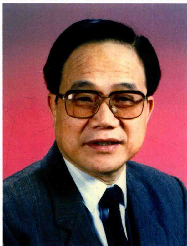
邬梦兆 华南文工团联谊会副会长 万年青艺术团名誉团长 原中共广州市委副书记、市政协主席