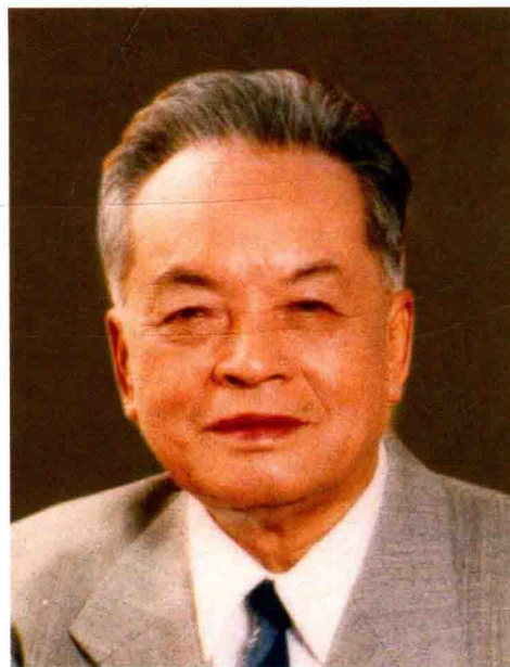
吕 坪 万年青艺术团顾问 原广东文学艺术界联合会党组书记 诗人