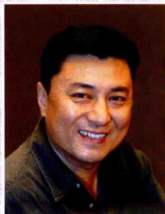
李仁义 万年青艺术团顾问 广东话剧院院长 国家一级演员