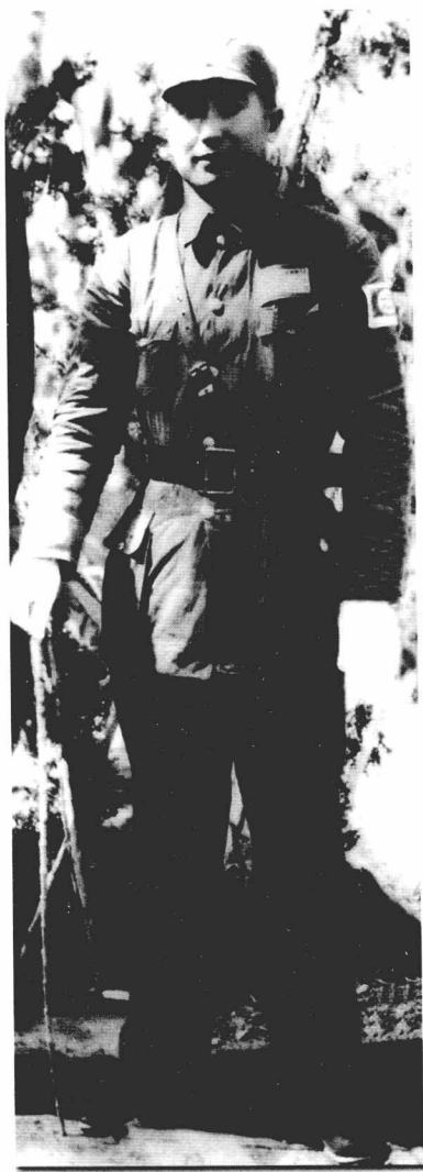
戴安澜(1940年摄于柳州)