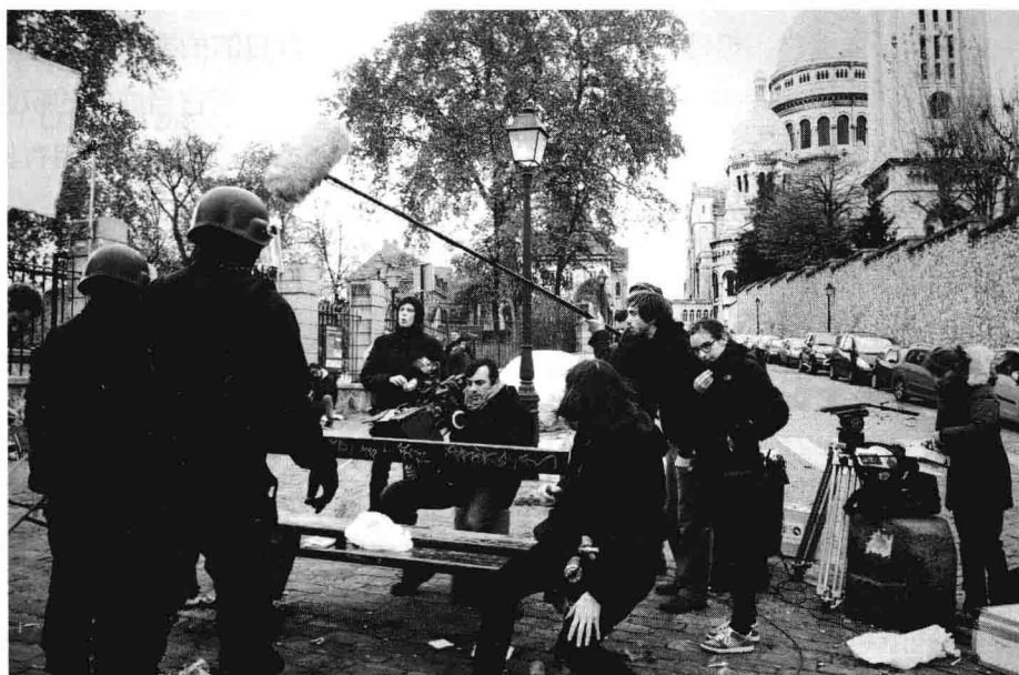
▲《亲爱的僵尸》在蒙马特高地进行拍摄。鉴于我们要拍一个空荡的城市，我们不得不在周日一早开始拍摄，以便对这个巴黎的旅游景点进行封锁。它由满座电影公司（Full House Films）、Ikonocast公司和Canal+频道联合制作。