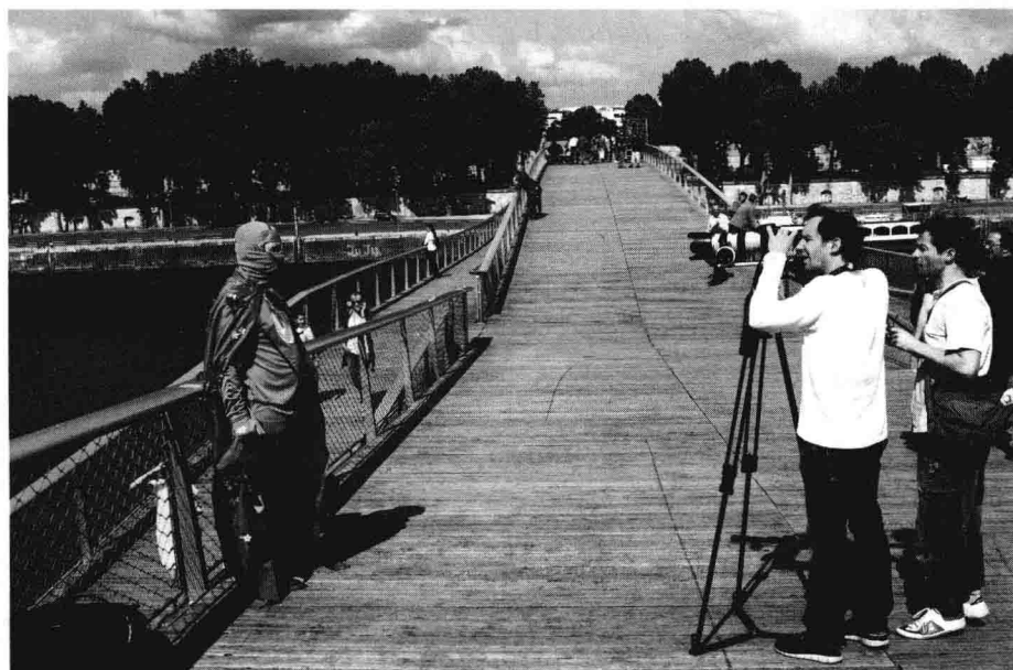
▲《环保男孩》在没有拍摄许可的情况下在巴黎的一座桥上进行拍摄，而在前方，一个大拍摄团队正在工作，我们必须避开他们的镜头方向。