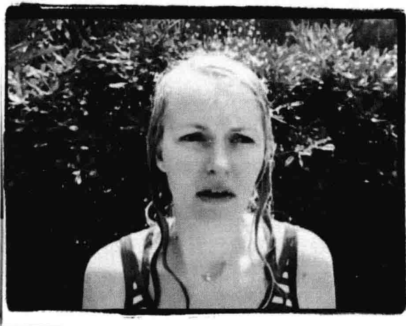
▲《雨天女孩》是上午用手机拍摄，下午在一台笔记本电脑上进行剪辑和校准的。迄今为止，影片已被超过 30 万人观看，在各个电影节上获取了多个最高奖项，在德法公共电视台 (ARTE) 和 (巴黎) 波堡文化中心 (Beaubourg) 放映。

正是在这样的精神指导下我和祖伊·费利克斯 (Zoé Félix) 还有贝热尼丝·贝乔 (Bérénice Béjo) 等人一起完成了像《亚当的苹果》(La Pomme d'Adam) 这样的影片，这是一部关于男女性别倒错的喜剧。我还用手机花了半天时间拍摄了《雨天女孩》(Rainy Girl)，手机只不过是一部诺基亚 N95——是的，甚至不是苹果手机 (iPhone)。这两部影片都在网络上取得了实实在在的成功，每一部都获得了 30 万以上的观众。这难道不就是最好的回报？！