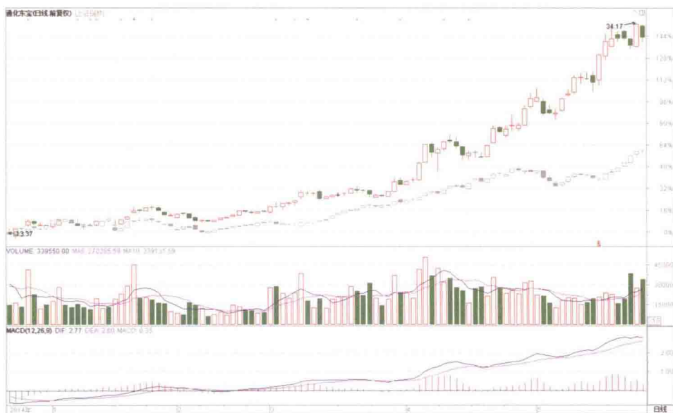
图 1-6 通化东宝日 K 线

顺势庄家即操纵股价走势与大盘走势相同，同涨同跌的庄家。这些庄家会在大盘上涨时顺势拉升，大盘下跌时顺势打压。长期看下来，股价在上涨阶段的涨幅要超过大盘，下跌阶段的跌幅要小于大盘，整体上涨趋势强于大盘。