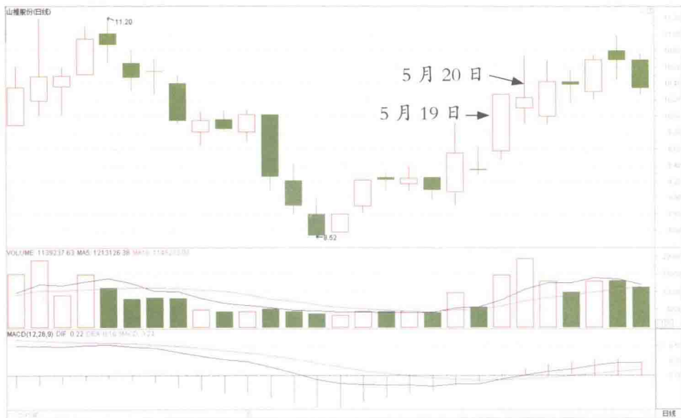
图 1-3 山推股份日 K 线

如图 1-2 所示, 从 2015 年 5 月 20 日山推股份的成交回报中可以看到, 当日卖出该股前五位的庄家与前日买入该股前五位的庄家完全相同。这说明前日大量买入股票的庄家当日已经将手中的筹码全部抛出。而当日买入的营业部十分分散, 每个营业部的买入额都很小, 这明显是有跟风买入的散户资金在买股接盘。