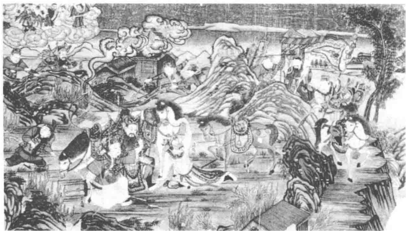
彩色卷本绘画《三国演义》

东汉宦官干涉朝政始于郑众。窦宪专权，和帝利用宦官郑众掌握的禁军力量清灭了窦氏势力，成功地夺回了政权。郑众虽为阉人，但为人甚有气度，才谋兼备，处事不居功自骄。和帝因郑众之功而封他为侯，从此开创了东汉宦官封侯的先例。汉殇帝死后，只有十三岁的安帝继位，邓太后临朝，邓鹭辅政。邓太后从窦家的失败里取得了一些经验，她并用外戚和宦官，但在形式上依旧偏重于外戚。建光二年（121），邓太后死，汉安帝终于得到了实际的权力，他登基后立刻着手打击邓氏一党，与宦官一起捕杀邓家人。在这一次政权更替中，宦官取得了更多的实际利益，他们得势以后，引用失意官僚与下层豪强做官，作为自己的