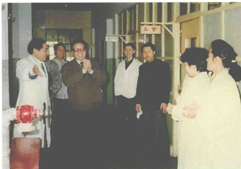
1991年11月12日，民航总局局长蒋祝平（前左二）视察民航上海医院