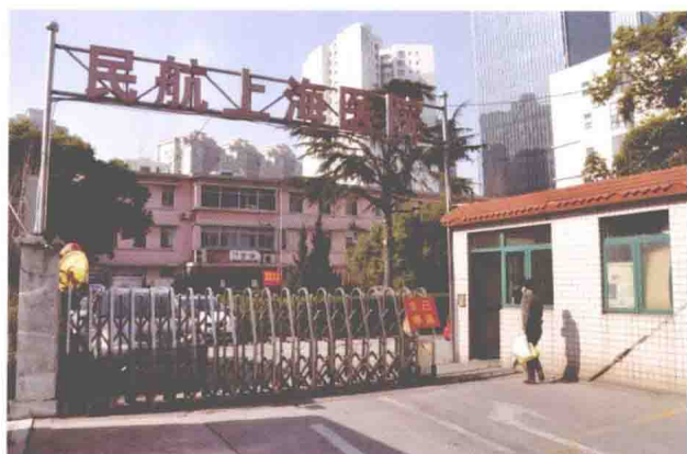
民航上海医院虹桥路1448号大门 (2011年12月拆除)