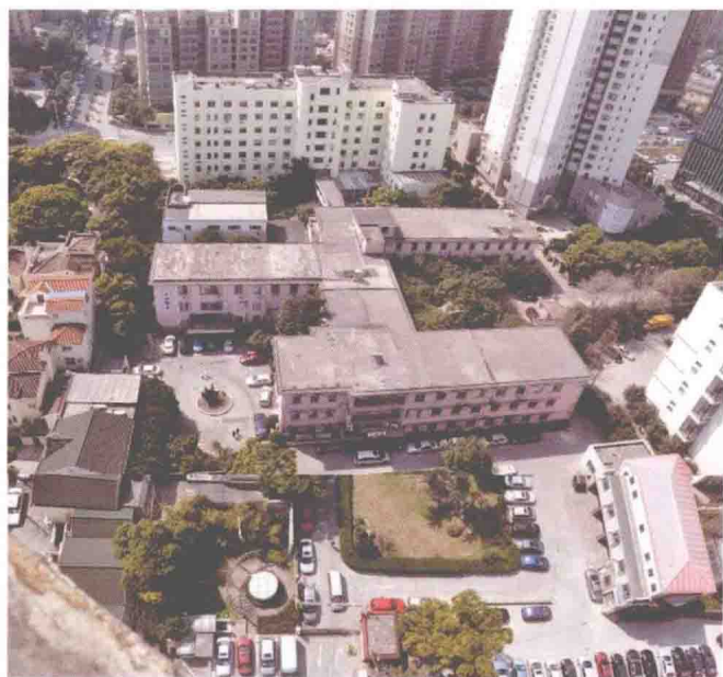
新一轮改扩建前的民航上海医院全景 (2011年9月1日)