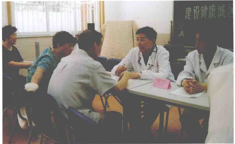
民航上海医院医师下社区为民服务（1996年10月）