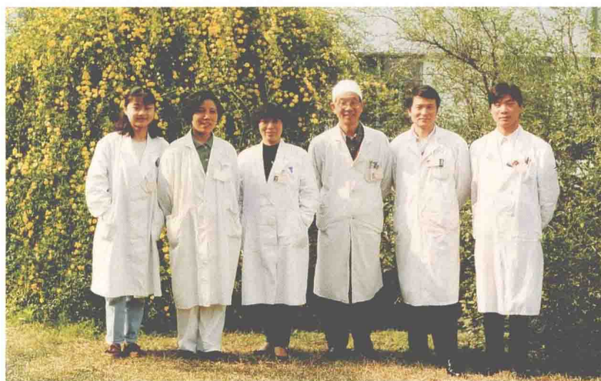
民航上海医院放射科于1994年1月荣获民航华东管理局先进生产(工作)集体称号