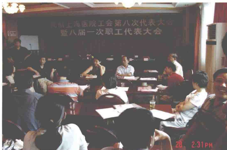
2004年8月28日至29日，民航上海医院召开第八次工代会暨第八届第一次职代会