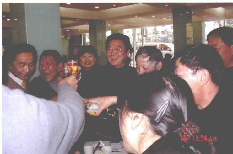
2008年1月16日，民航上海医院组织退休员工迎春团拜会