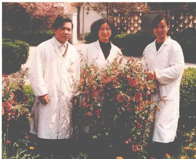
民航上海医院检验科于1995年1月荣获民航华东管理局先进生产(工作)集体称号