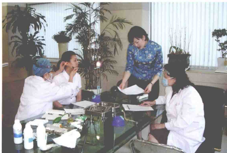
民航华东地区管理局航空人员体检鉴定中心耳鼻咽喉科医师在韩国为中国东方航空公司招收韩籍空乘人员进行体检（2007年11月3日）