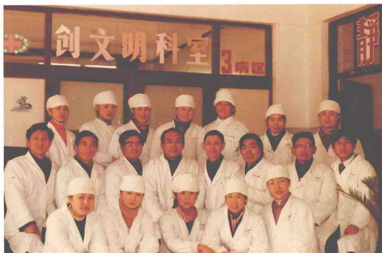
民航上海医院外科于 1986 年 1 月荣获民航上海管理局先进集体称号