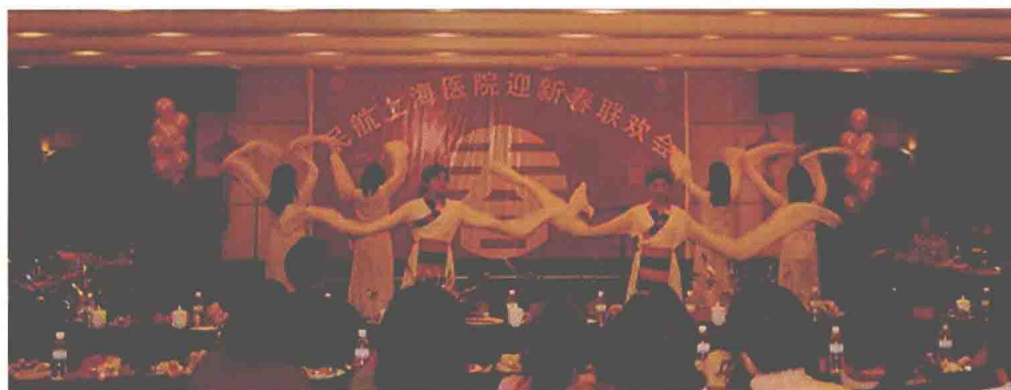
民航上海医院 2004 年迎春联欢会