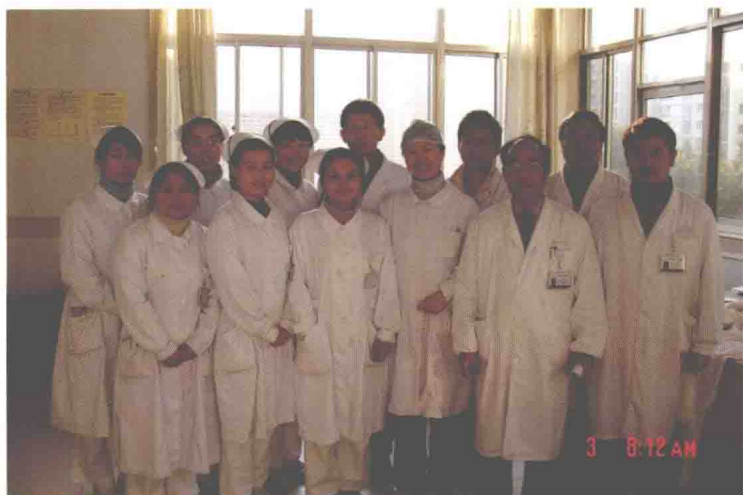
民航上海医院内科病区、外科病区、手术麻醉科医护人员合影 (2008年1月3日)