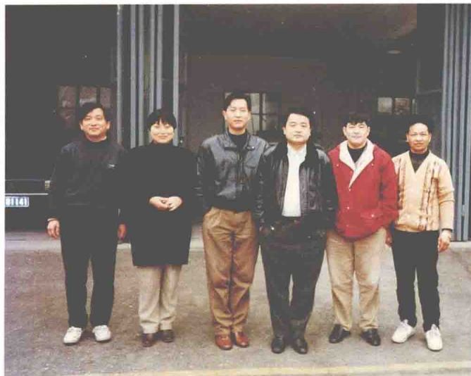
民航上海医院总务科汽车班于1997年1月荣获民航华东管理局先进生产（工作）集体称号