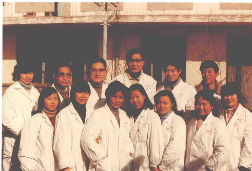
民航上海医院内科于1985年1月荣获民航上海管理局先进集体称号