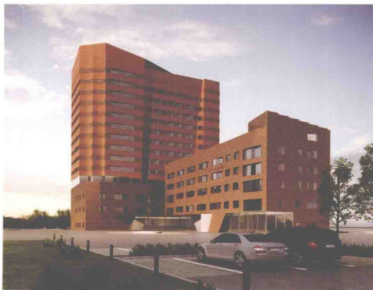
2012年5月奠基的在建综合 医疗大楼效果图