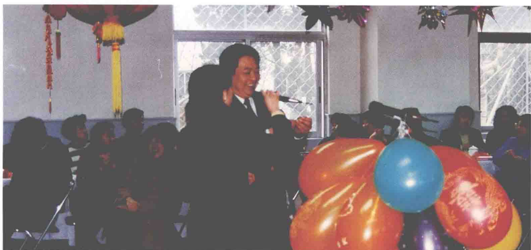
民航上海医院举行 1997 年新春联欢会。民航华东管理局局长叶毅干（右站立者）出席