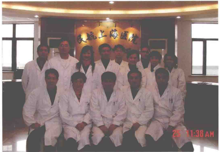
民航华东地区管理局航空人员体检鉴定中心于2006年2月荣获民航华东地区管理局先进集体称号