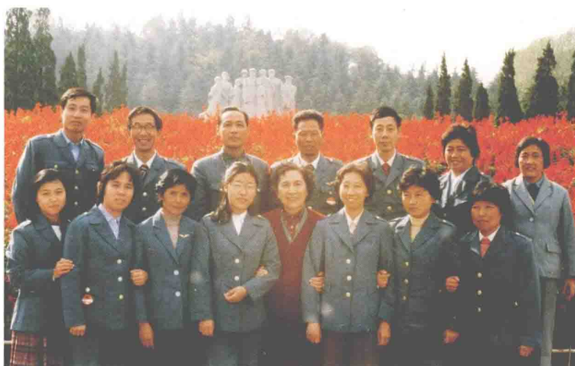
1984年秋，民航上海医院工会组织职工到南京疗养，在雨花台合影