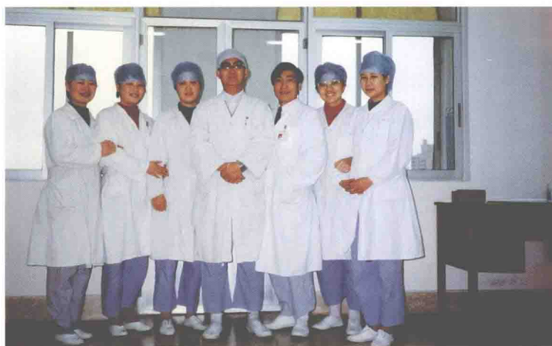
民航上海医院手术麻醉科于2000年2月荣获民航华东管理局先进集体称号