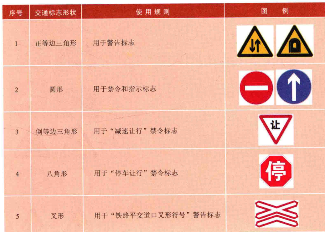
表 1-2-2 交通标志形状特征