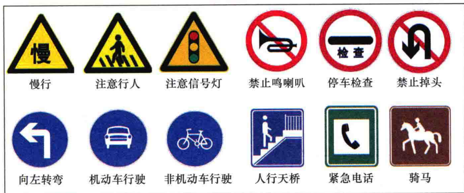
图 1-2-1 图案直接表达含义的标志

交通标志中有一大半标志其图案与表达的含义非常接近，如图 1-2-1 所示。此类标志只要看一二遍便能轻松记住，对题库中此类简单试题会做后，在试题旁做个标记，复习时不必再看，这就是“去简”。