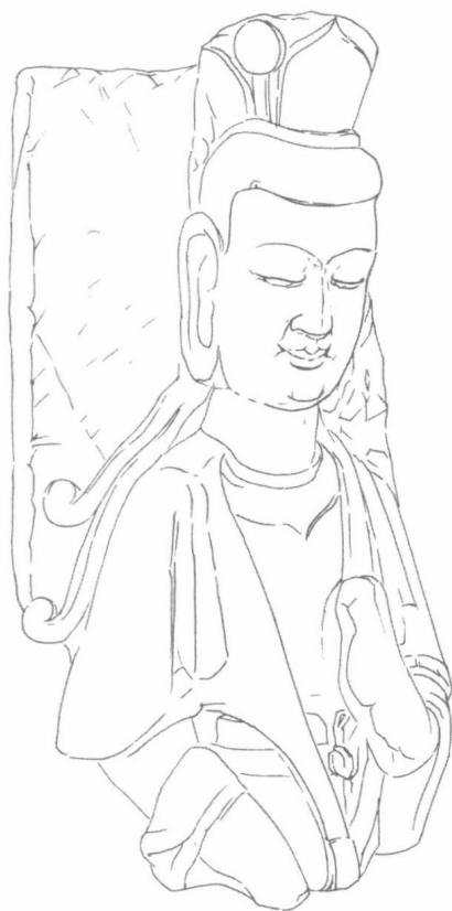
图 1-3 半身石雕菩萨像（北魏）