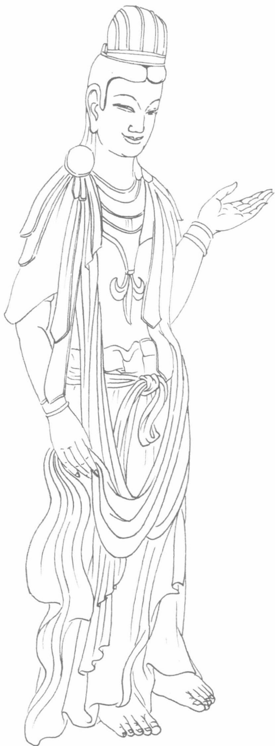
图 1-2 胁侍菩萨石雕像（北魏）麦积山石窟第 127 窟