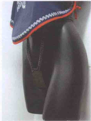
圖0-4 中國清末的一條青銅護盾貞操帶 by 劉映

從2001年起，中國各地的“性保健”公司進口各種美國的皮制男女貞操帶，主要在網上銷售，有一陣還列在各種性用品銷售排行榜的首位。2004年以後，金屬貞操帶也開始出現在中文的銷售網站上（這