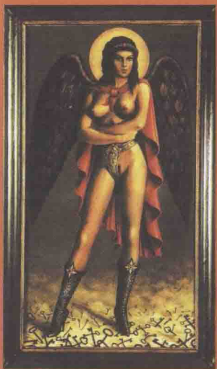
圖 1-1 穿着貞操帶的 聖母（油畫）佚名