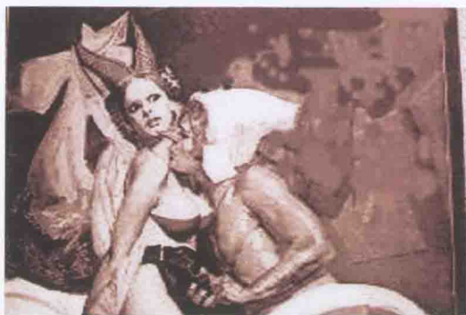
圖 1-2 給魔女鎖上貞操帶 (西班牙)

都有年輕女性到愛神廟裏居住幾年，獻身于過路男性的習俗，古稱“淫祀”，然後才能成婚為妻。先失去貞操，才能保住貞操，這是最早的貞操意識。女性為推動人類的性文明作出了巨大的貢獻。