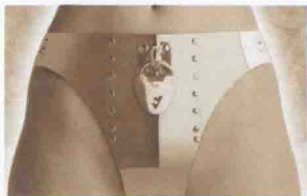
圖0-5 因特網雜誌廣告