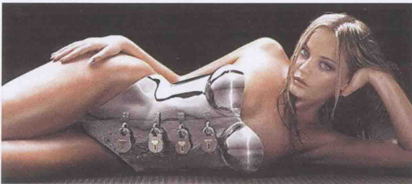
圖0-6 奧迪汽車報警器廣告

1998-1999年，由于印度尼西亞發生軍人騷亂，大批居住在印尼的華人，特別是婦女遭受軍人蹂躪，那裏的簡易貞操帶銷量因此劇增。一時間，印尼的貞操帶成為