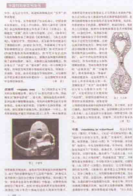
圖0-3 《中國性科學百科全書》“貞操帶”條

最大的一個關於貞操帶的個人專題網站（www.tpe.com/~altarboy），雖然一度（2005-2006年間）關閉半年，總點擊人次已經超過了1300萬，其他十幾個較大的貞操帶專題網站的點激人次也都有數百萬。德國2004年以來出現多個新的貞操