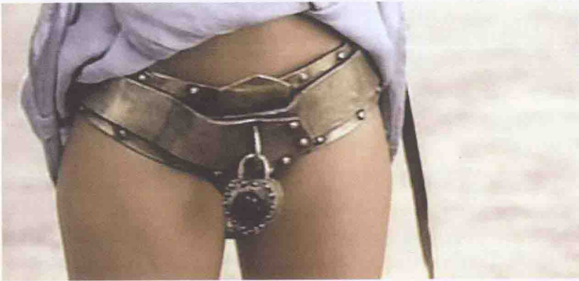
【圖0-2】惡搞《300斯巴達勇士》劇照

會結構和人與人的關係。貞操帶的有限流行，至少會在流行的圈內，改變人與人的關係。本書的任務之一，便是講述這種微妙的變化關係，這是一個平常人難以窺見的領域。