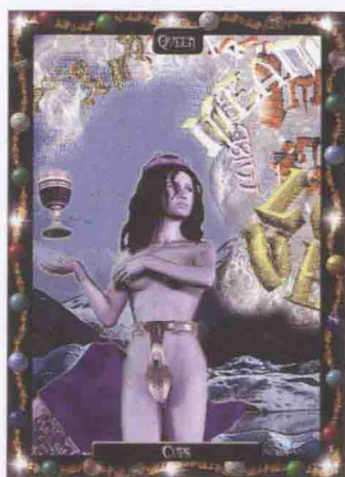
圖 0-1 貞操公主 by Chas

2004年2月7日，世界各傳媒都發布了一條并不確切的消息：《金屬貞操帶惹禍：一女子在機場致探測器鈴聲大作》。消息雲：“一名40歲的英國婦女在雅典國內機場通過安檢時，引得金屬品探測器鈴聲大作，困惑的安檢人員很費了一翻周折，發現是她穿的金屬貞操帶激活了探測器。據機場安檢人員透露，這名來自倫敦的婦女告訴他們，她丈夫怕她在希臘短短的幾天的旅行中發生婚外情，逼迫她穿上一條金色貞操帶。最後，這名婦女被放行。”這位婦女為了解釋，在一個名為“鎖的菜單”（ www.lockmeup.com ）的論壇上做了事實的更正：