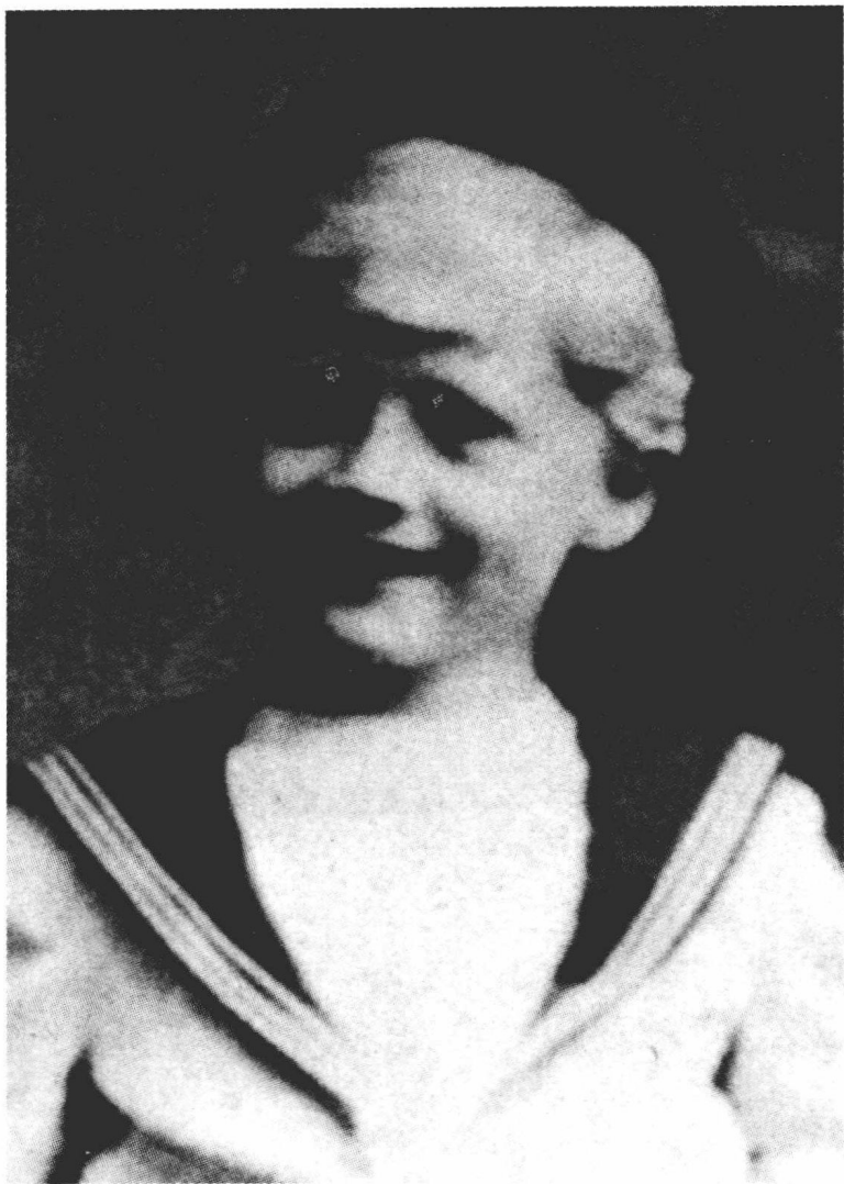
◎ 1885年11月11日，乔治·史密斯·巴顿出生于美国加利福尼亚州南部的圣加布里埃尔。图为七岁时的巴顿。

巴顿后来说，他从来没有忘记这句话：“尽管我们离得越来越远了，我们的心却从来没有分开过。”