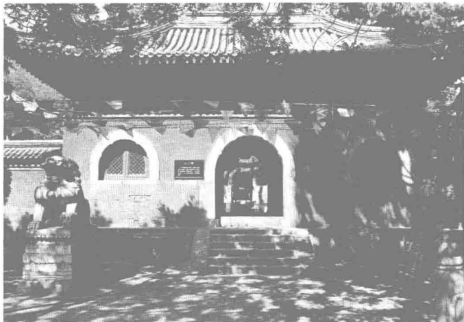
整修前戒台寺山门殿

护持国土，领毗舍闍（此云颠狂鬼）、乾闥婆（此云香阴）神将，是帝释天的主乐神，所以此天王手中持琵琶以作标帜，护东方弗提婆（此云胜）洲人民。南方天王名“毗琉璃”（此云增长），能令他人善根增长，所以手中持剑，领鸠槃荼（此云雍形鬼）、薜荔（此云饿鬼）神，护南阎浮提（此云胜金）洲人。西方天王名“毗留博叉”，此云广目，能以净眼观察护持人民，领诸龙及富单那（此云臭饿鬼），所以手中缠绕一龙，护西瞿耶尼（此云牛货）洲人。北方天王名“毗沙门”，此云多闻，有大福德，护持人民财富。右手持伞，表福德之义，护北郁单越（此云胜处）洲人（见《长阿含经》卷一二《大会经》）。世俗称为四大金刚，这也是《封神演义》中的戏言，金刚与天王是不可混淆的。