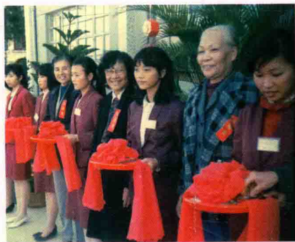
▲作者参加女师校友楼剪彩。