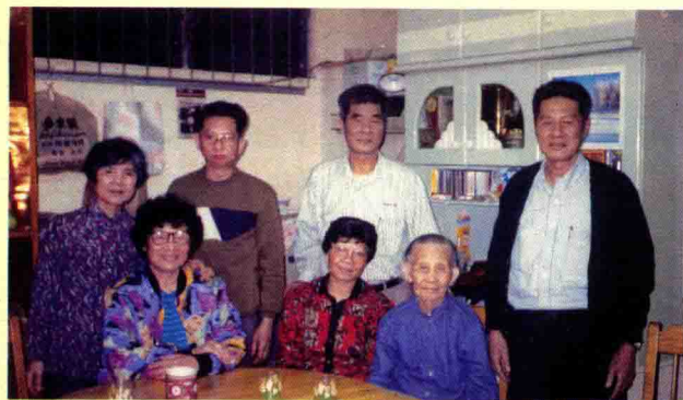
作者和母亲、弟、妹 在一起。影于一九九三年。