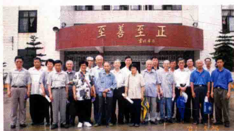
▲作者参加台山政协联谊会教育小组活动。