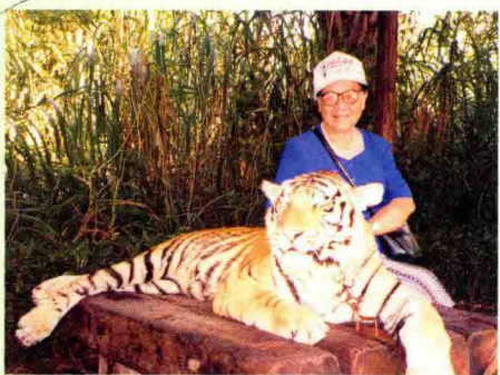
游动物园。摄于1998年10月15日。