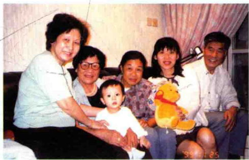
▲作者在香港二弟家。