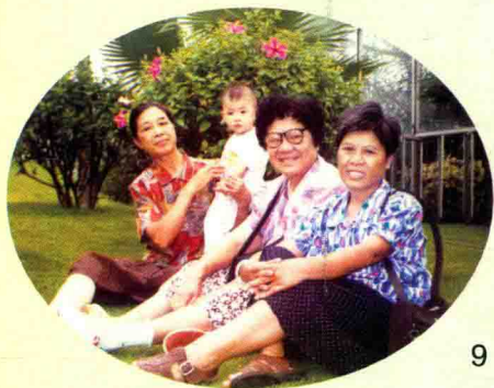
游云台公园。摄于1999年9月19日。