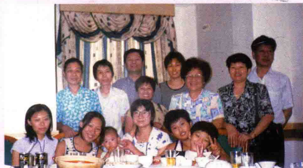
▲ 我的一家子,四代同堂。摄于1999年8月8日。