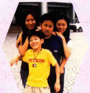
▲ 我的孙女孙子,摄于2001年5月2日。