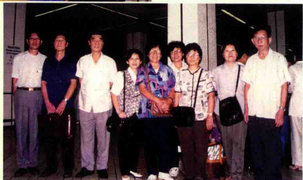
一九九四年八月在香港，合家送欢 莲回美。