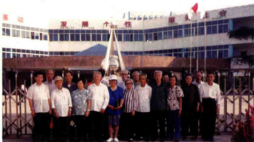
▲作者参加台山民盟退休支部活动。