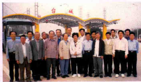
▲作者参加台山诗词学会活动。