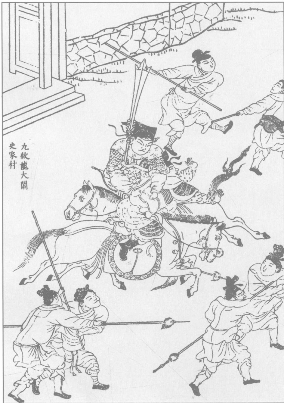
第一回 九纹龙大闹史家村