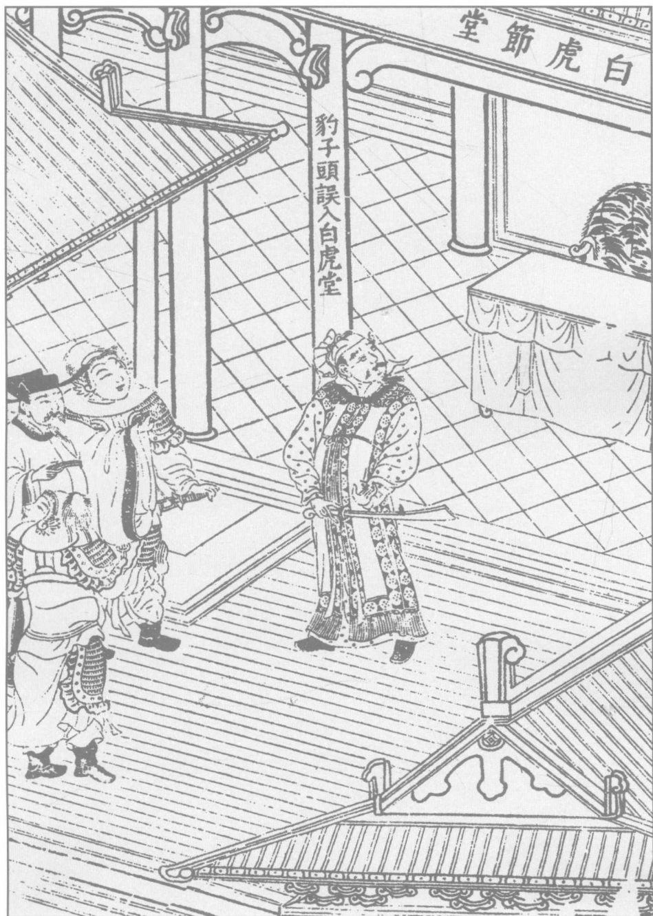
第六回 豹子头误入白虎堂