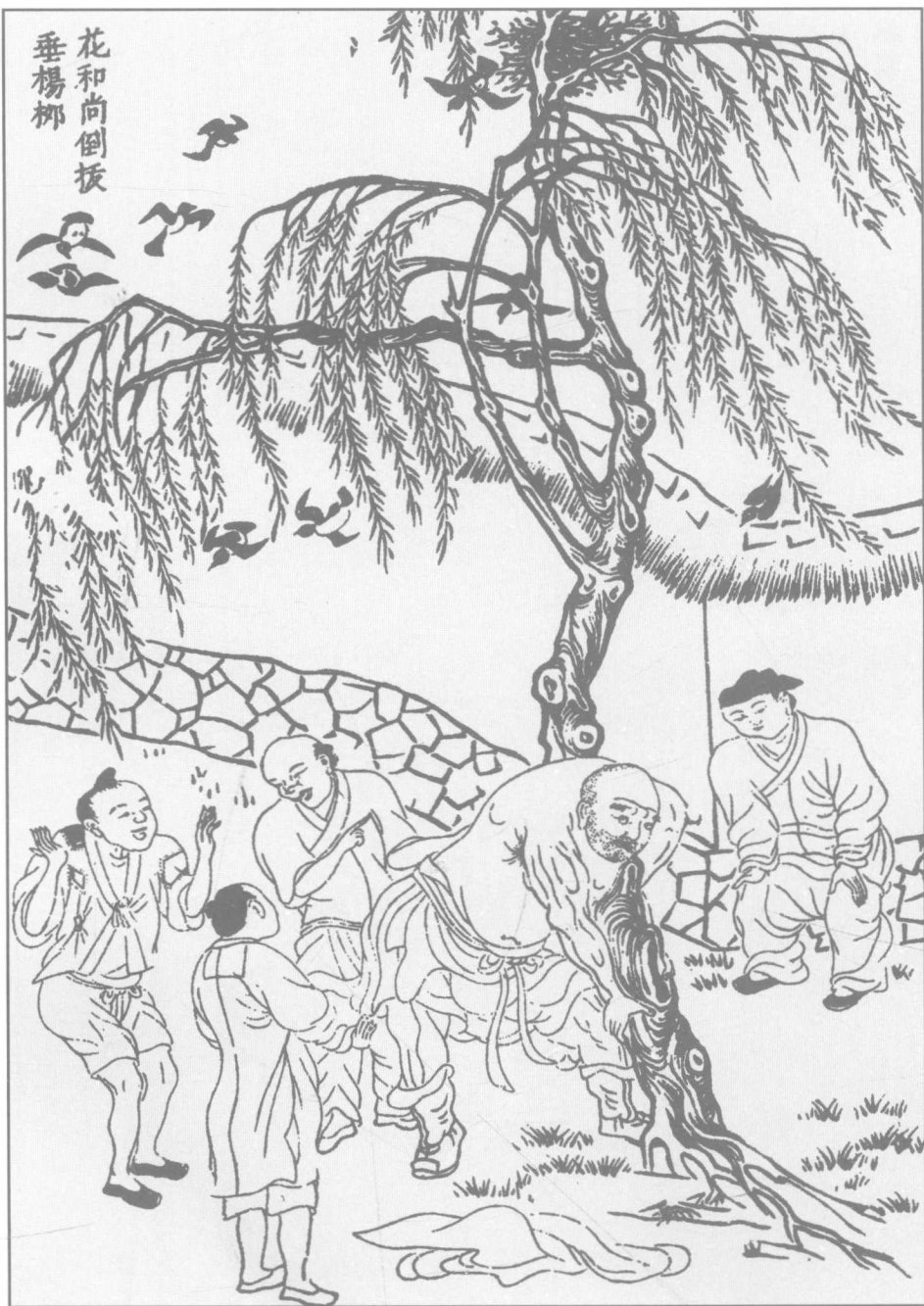
第六回 花和尚倒拔垂楊柳