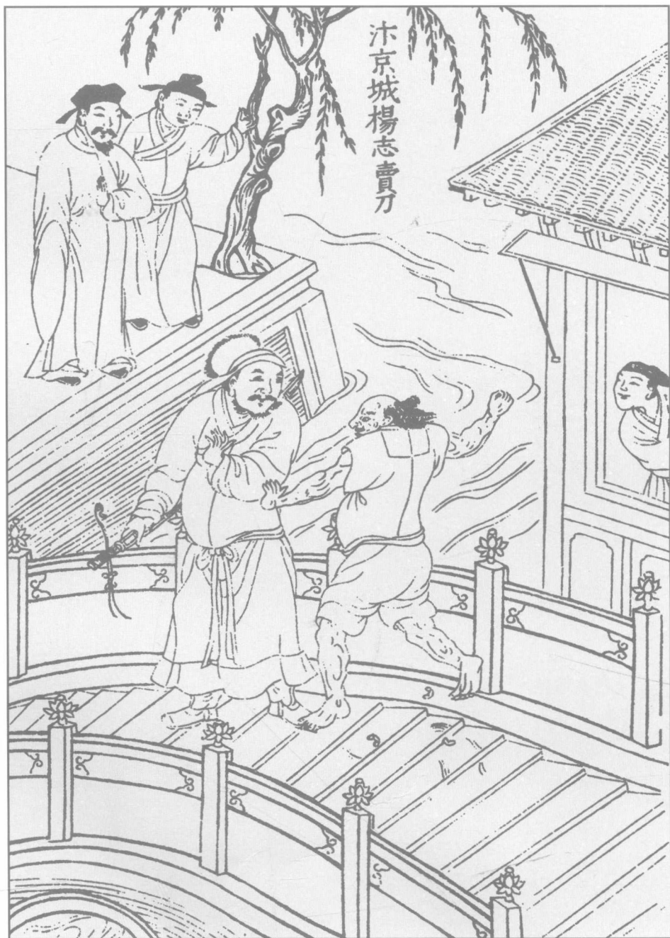
第十一回 汴京城楊志賣刀