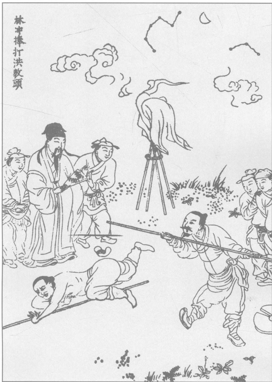
第八回 林冲棒打洪教头