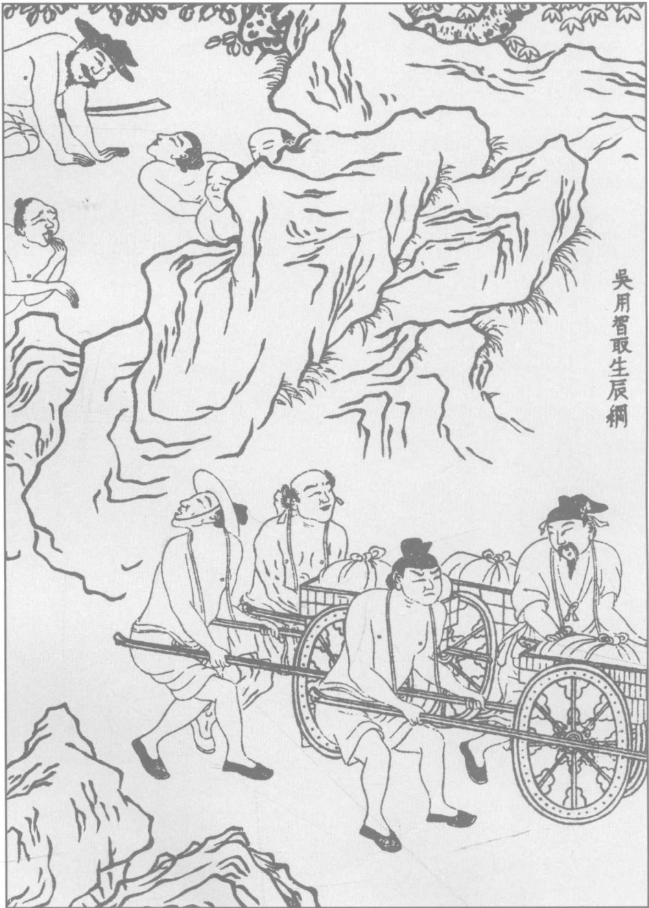
第十五回 吳用智取生辰綱