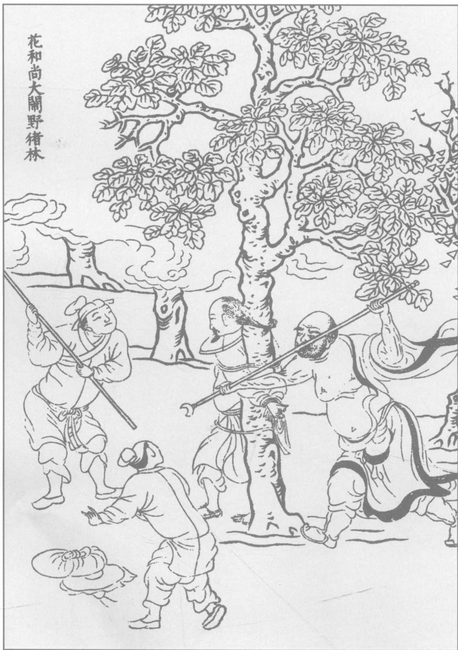
第七回 花和尚大鬧野豬林