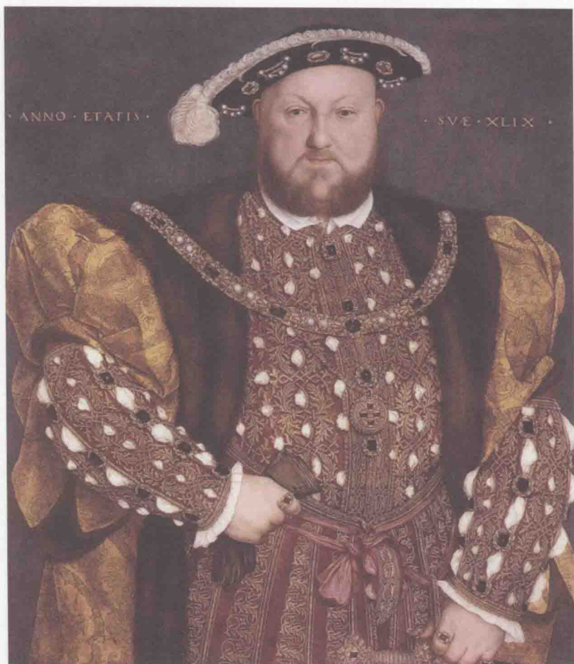
亨利八世，1491（生）1509（登基）1547（薨），在位37年9个月