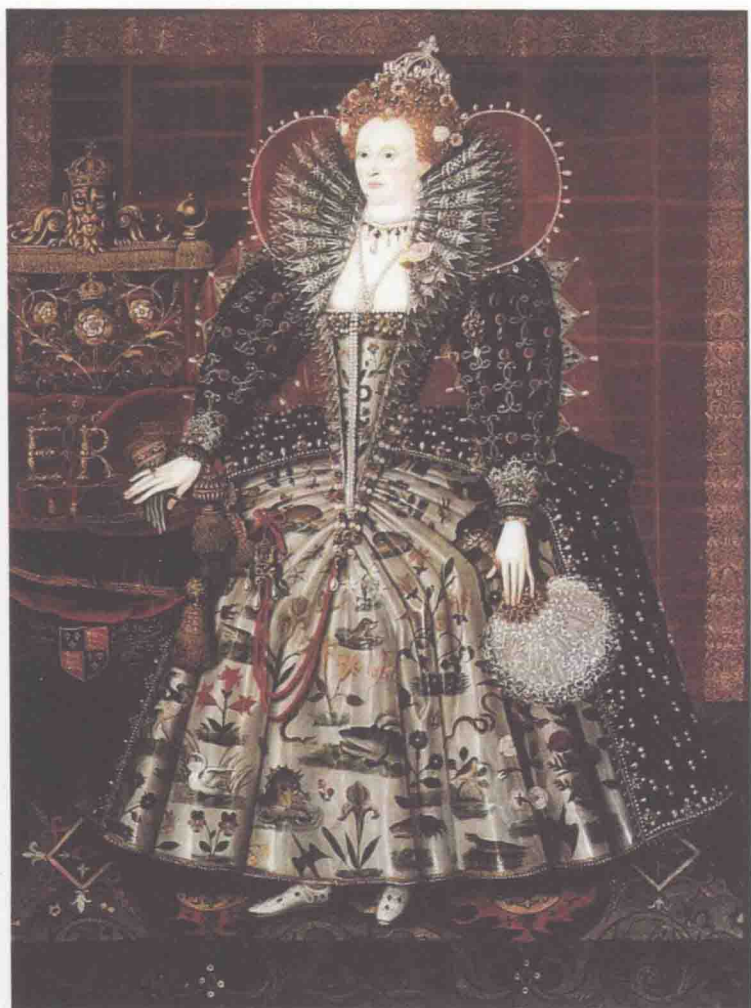
伊丽莎白一世，1533（生）1558（登基）1603（薨），在位44年7个月