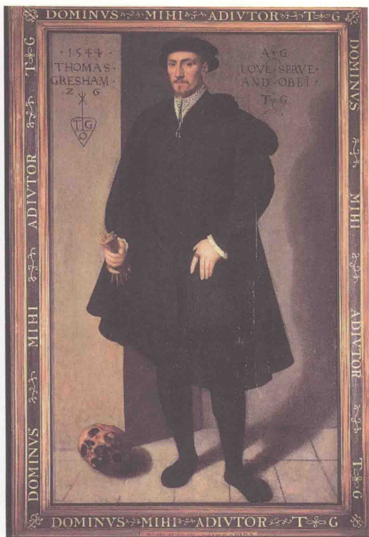
格雷欣与安妮·费内利结婚时（1544，26岁）