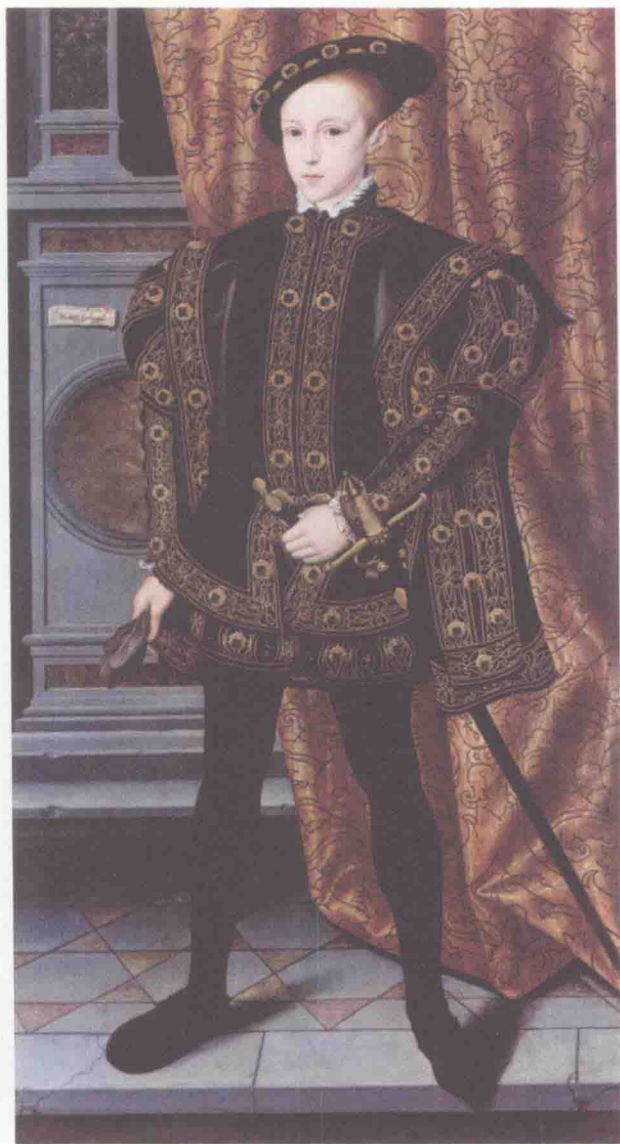
爱德华六世，1537（生）1547（登基）1553（薨），在位6年5个月