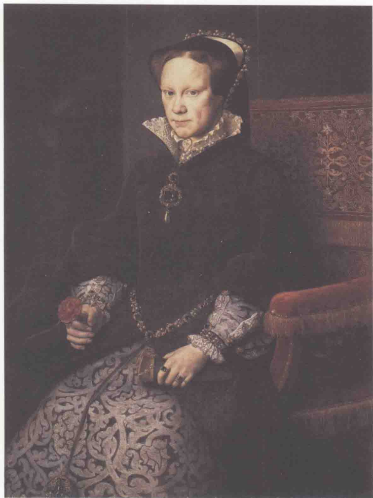
玛丽一世，1516（生）1553（登基）1558（薨），在位5年4个月