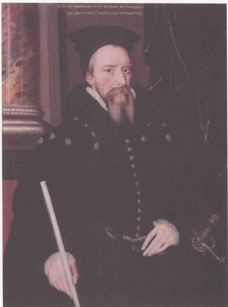
伊丽莎白一世的首辅威廉·塞西尔爵士（伯利勋爵，1520—1598）