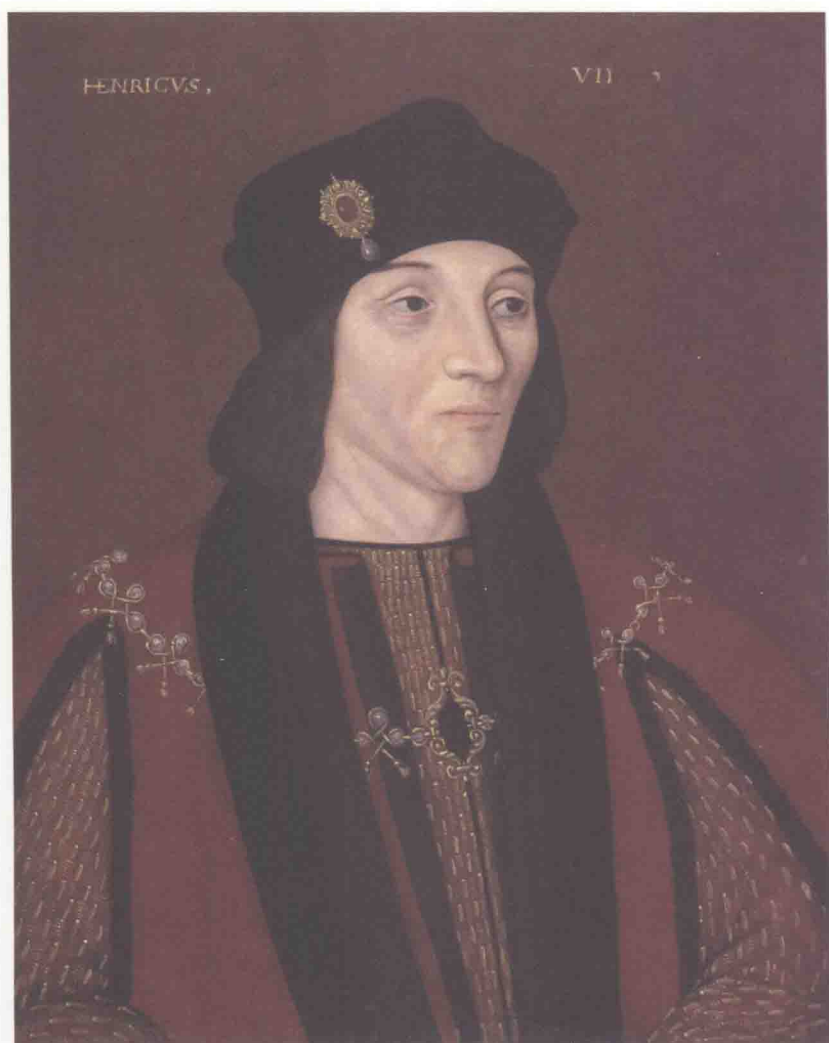
亨利七世，1457（生）1485（登基）1509（薨），在位23年8个月