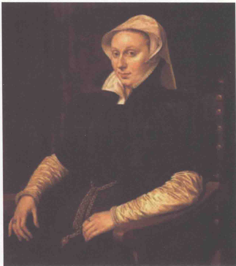
格雷欣爵士夫人，安妮·费内利·里德·格雷欣女士，1520—1596（约1560） Portrait by Sir Anthonis Mor van Dashorst.