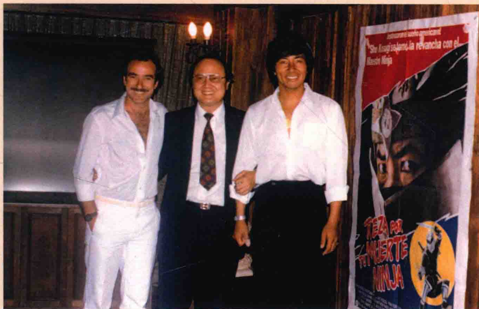
與好萊塢日本忍者明星小杉正一（右）合影