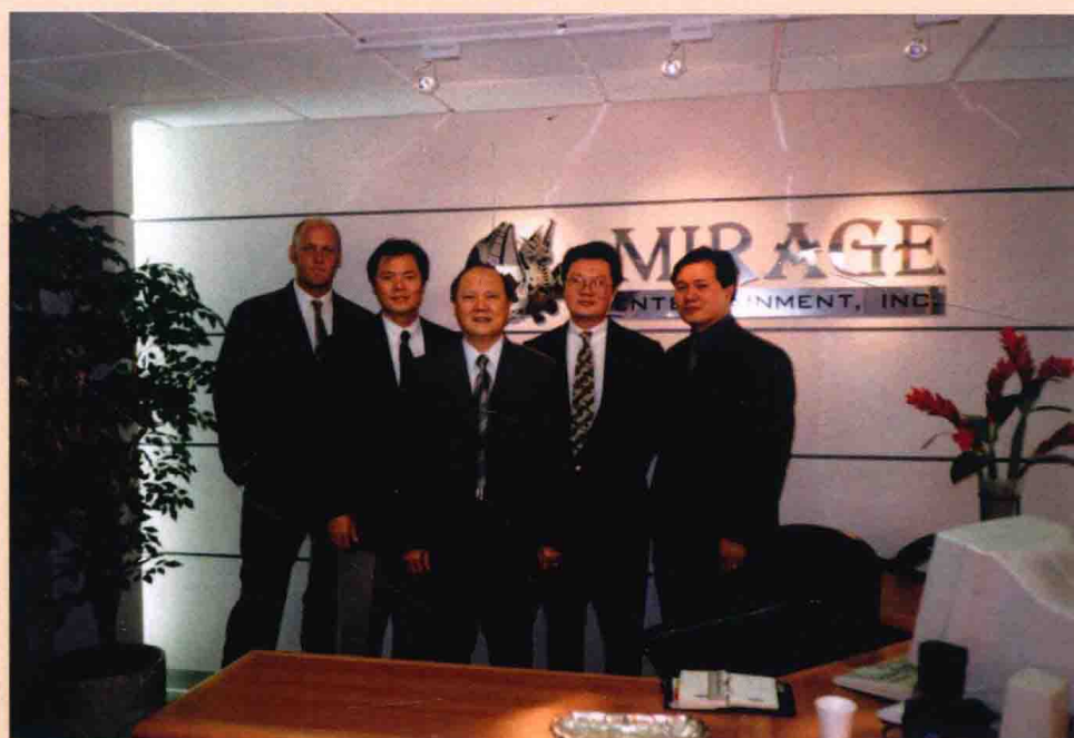
泛美亞機構成員布萊、永昌、高總裁、永興、永隆合照（由左至右）