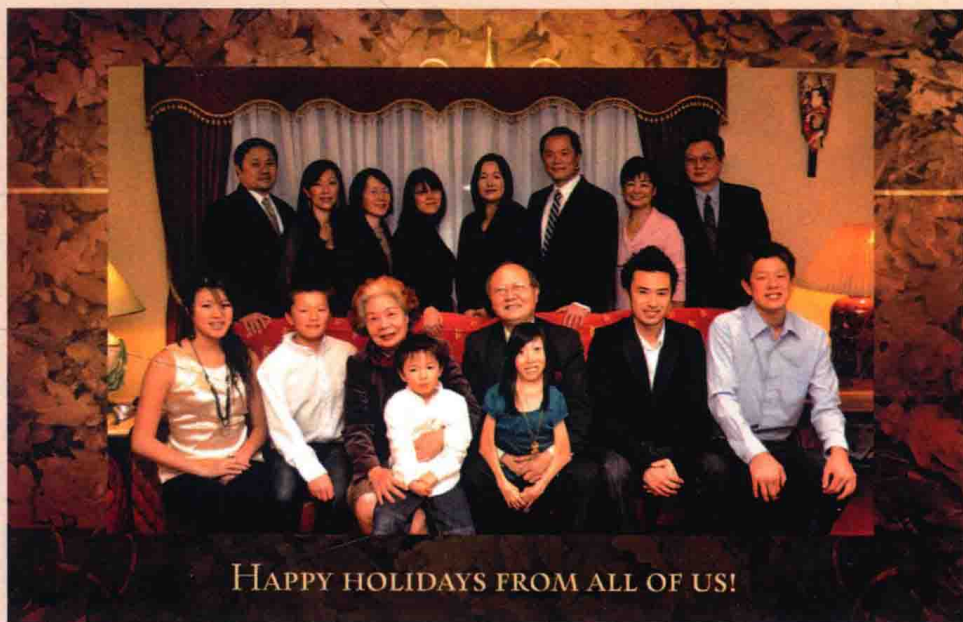
| 2010年金婚紀念日全家福合照