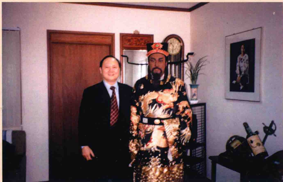
與台灣著名電視劇《包青天》主角金超群（右）合影