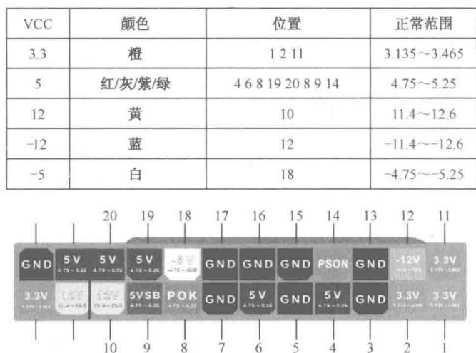
图 1-1 引脚的排序编号及所用电缆的颜色与输出电压的关系

ATX 电源输出端子上的各个引脚是按照固定顺序依次编号的，并且输出端子所使用的电缆的颜色也具有明确的含义，即特定颜色对应特定输出电压或信号。ATX 电源输出端子的各个引脚的排序编号以及所使用的电缆的颜色与输出电压的对应关系如图 1-1（清晰大图见资料包第 1 章/图 1-1）所示。