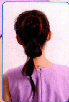
Back / 背面