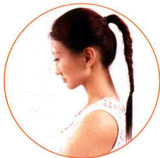
Side / 侧面