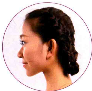
Side | 侧面