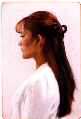
Side | 侧面