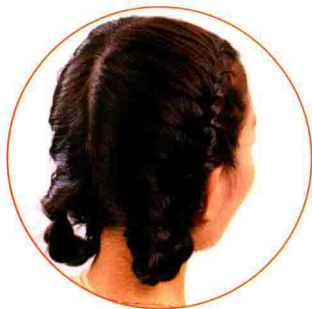
Back | 背面