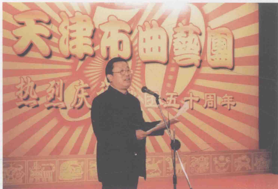
2003年主持天津市曲艺团建团五十周年庆典