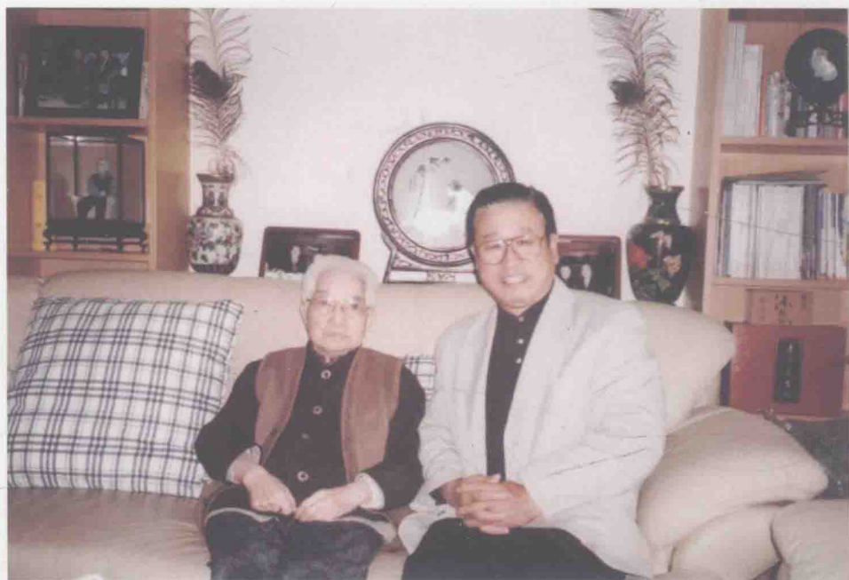
与骆玉笙大师合影