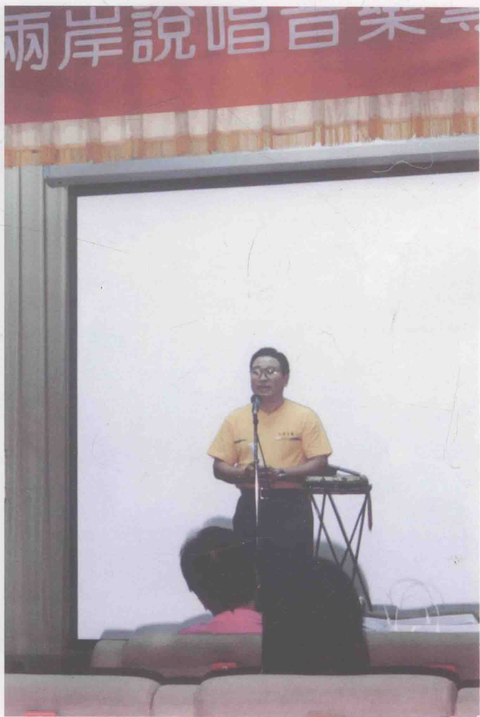
2001年在台湾师范大学学术厅参加说唱艺术讲座