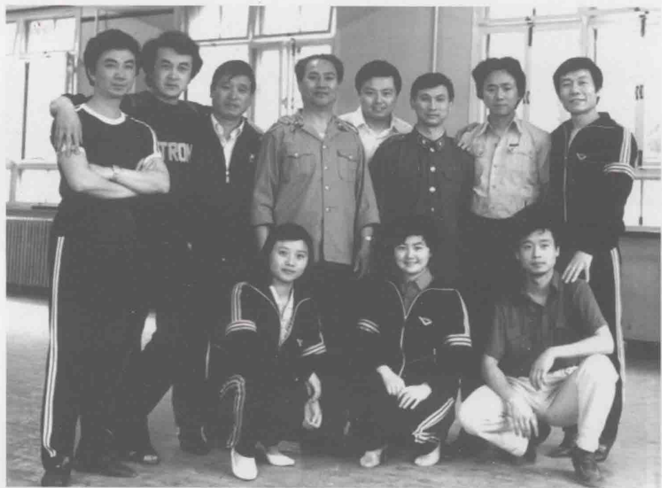
1987年在解放军艺术学院学习期间与同班同学合影