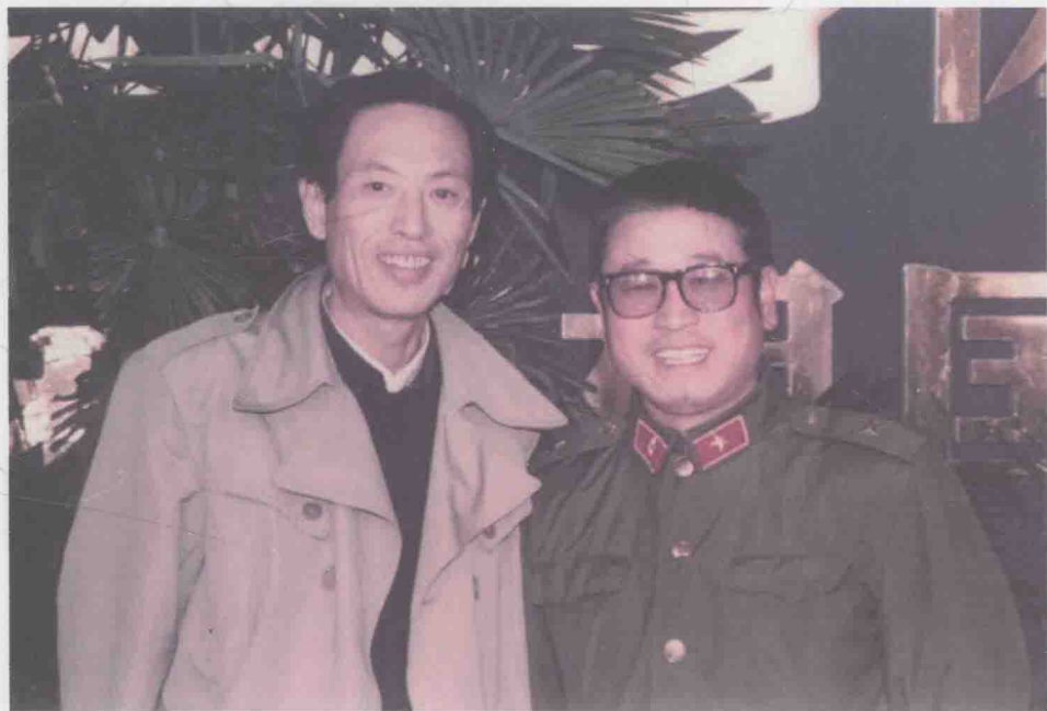
与常宝霆先生合影