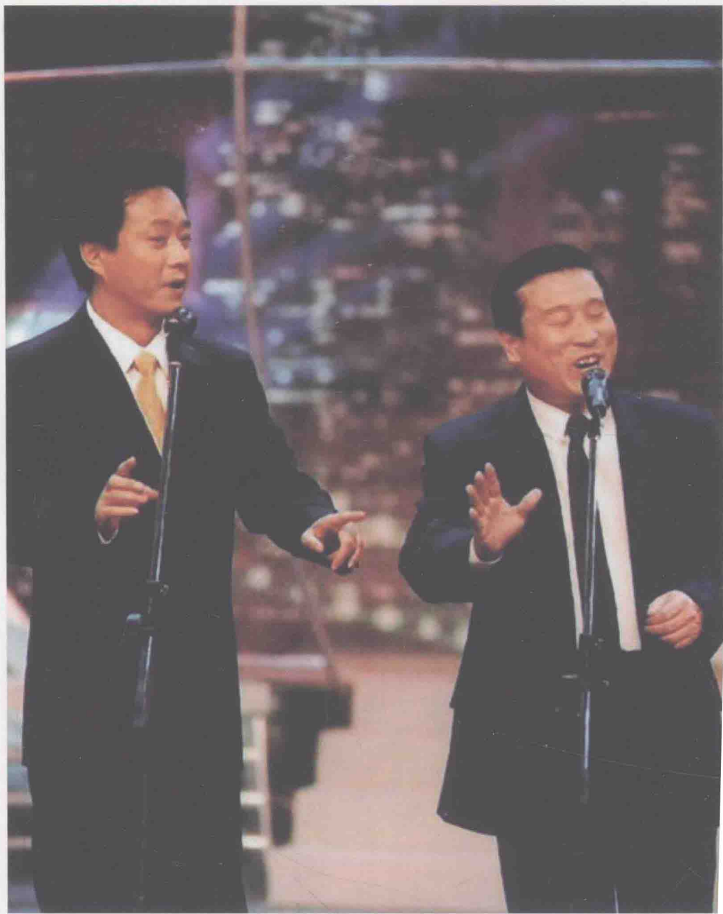
与中央电视台节目主持人朱军演出照