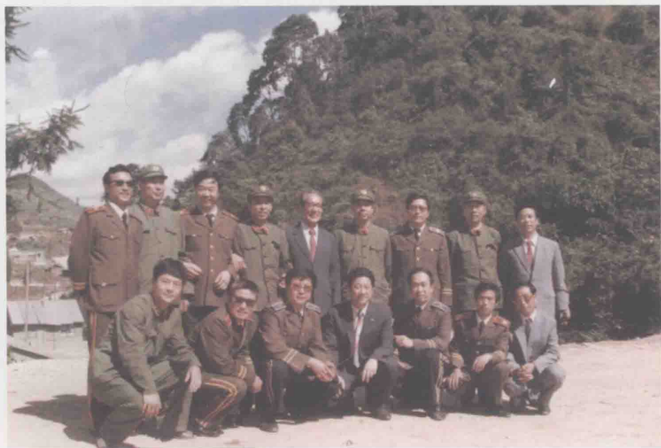
1985年随总政曲艺队赴老山前线慰问演出