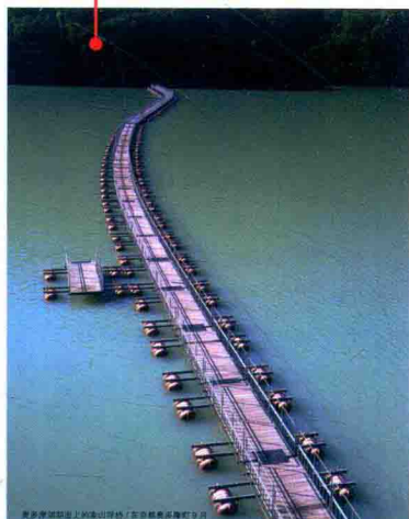
相互映衬的樱花、碧绿湖水和浮桥

奥多摩湖的正式名称是“小河内水库”，它是一个建于1957年的人工湖。作为水厂水库，它在用于多摩川防洪的同时配有发电设备，是日本最大的水厂水库。西御的丹波河和小河内河都流入奥多摩湖中，成为多摩川。