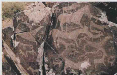
图3 阿尔泰山岩画:动物图

阿尔泰山岩画,分布在阿勒泰地区的青河、富蕴、阿勒泰市、福海、布尔津、哈巴河、吉木乃六县一市,为新疆岩画数量最多地区,主要以洞穴彩绘岩画为主。内容多为奔跑的骏马、鹿和羊群,其线条简练、造型生动。有数以千计的岩画雕刻在山体的岩壁或较大的岩石面上,所表现的题材和内容丰富多彩(图3~9)。布尔津县阔斯特克乡和也格孜托别乡一带的以山羊为主的岩画,画面错落有致,形态各异,线条清晰明快,走笔流畅;