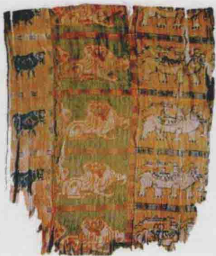
图 4 方格兽文锦 (5~6 世纪) 吐鲁番阿斯塔那古墓出土

鲁木齐市南山矿区、天山阿拉沟山口一带古墓中出土有记虎纹圆金牌 8 块,银牌 7 块,狮形金、菱形浸泡饰片等金银浮雕饰物,这些浮雕由模子压制而成,技艺甚精,表明塞种人的金属冶炼和雕刻技术都很高,他们崇尚以野兽图案为主体的艺术形象,这些动物形象形式对称,构图完美,动作极夸张生动,富有装饰情趣,显示出很高的艺术成就。