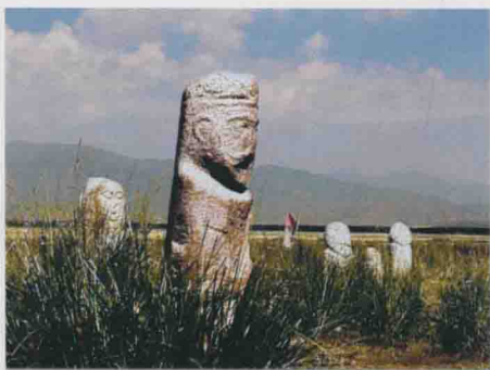
图 2 突厥草原石人雕像(6~8 世纪)伊犁昭苏

的鹿石雕刻和草原石人、神秘的葬俗木雕及多姿的彩陶艺术等。新疆的岩画,遍布阿尔泰山、天山、昆仑山三大山系,最早的距今已有一万年左右。其中著名的呼图壁康家石门子岩画,是世界上罕见的以表现生殖崇拜为核心内容的巨幅岩刻画,堪称举世无双之精品。鹿石和石人,主要分布在北疆的阿勒泰、伊犁、博州等地,鹿石雕刻在我国仅为新疆所独有,距今已有 3000 年以上的历史,是古