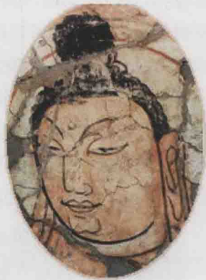
图7 佛头像(壁画,3~4世纪) 于田县喀拉墩佛寺遗址出土

宋元明清时期,随着伊斯兰教传入新疆并逐渐扩展,伊斯兰文化对新疆文化的影响愈来愈大。大量的伊斯兰建筑兴起,新疆伊斯兰建筑经过长期的发展演变,逐渐将阿拉伯建筑风格与新疆当地维吾尔建筑风格和中原建筑风格结合起来,既保持了原有的风格,又表现出鲜明的中国特点和民族色彩,成为中华民族建筑文化的有机组成部分。由于宗教信仰的冲突以及伊斯兰教反对偶像崇拜的特点,佛教中大量的石窟佛寺、壁画雕塑等在伊斯兰化进程中遭到损毁,佛教的主体地位逐渐被