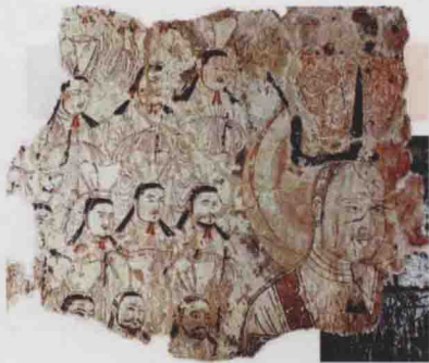
图 3 摩尼教壁画唐代(7~10 世纪)高昌故城出土(德国探险队割取)

奴隶社会时期,生活在西域的塞种人创造了辉煌的青铜文化。在新疆的伊犁河流域各地,曾多次发现有大量红铜或青铜的器具和武器。1983 年,在伊犁新源县出土了 6 件铜器,有铜武士像、铜三足带耳釜、铜铃、对虎圆环、对翼兽圆环和高喇叭方座承兽盘。其中著名的铜武士造型英俊,形态逼真,面目丰满,身体呈蹲跪式,头戴尖顶帽,其面目形象所反映出的“深目、高鼻”的特征,表明塞种人所具有的体貌特征颇有欧罗巴人种的形态。塞种人、匈奴、突厥等民族还非常崇拜黄金,1976~1978 年,在乌