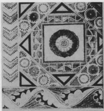
图 8 勒柯克在吐鲁番七康湖佛寺发现的绘制灯笼式藻井

年之久。事物的发展具有两面性,伊斯兰艺术抑制了绘画、雕塑等形象性写实艺术的发展,却促成了民间装饰艺术的繁荣,绚丽多彩的建筑装饰艺术以及琳琅满目的少数民族刺绣、花毡、土印花布、艾德来斯绸、地毯、土陶、小刀、木雕工艺等,又成为新疆丰富多彩的民族民间艺术的一大亮点。另外,新疆 13 个主体民族的服饰艺术、民居建筑等民间艺术也充满着独特的异域样式和丰富的视觉语汇。