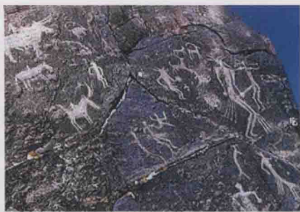
图2 裕民县巴尔达库尔山岩画:生殖主题

1965年,在阿勒泰地区展开首次文物普查,在各地县不断发现岩画 [4] 。到了七八十年代,随着新疆文物考古工作的深入开展和广大岩画爱好者的调查参与,在新疆三大山系和准噶尔西部山地都有新的岩画发现。据目前统计,新疆已有40多个县市发现了岩画,总约300余处,是全国岩画数量最多、内容最丰富的省区。新疆岩画主要分布在阿尔泰山、天山、昆仑山,以及三山环抱的准噶尔盆地、塔里木盆地周缘的丘陵山地。主要见于冬季牧场、中低山区以及转场牧道上,高山草原峻峭伟岸的山岩上也有零星发现。上述地区的自然条件优越,有丰盛的牧草,自古以来就是各族人民狩猎、放牧的理想天地。总的分布情况是南部的昆仑山系较少,中部的天山山系较多,北部的阿尔泰山最丰富。