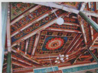
图 9 莎车清真寺的藻井图案

中华人民共和国成立以前,内地的画家韩乐然、赵望云、司徒乔等先生先后来新疆采风写生,他们通过画笔向外界宣传展示了新疆的民风民情、异域风貌,使沉寂多年的丝绸之路又重新焕发出光彩,这些画家同时又在新疆播下了绘画的种子。特别是韩乐然,不仅为后人留下了大量新疆写生作品,他还花费了极大的精力,临摹克孜尔石窟壁画,开启了以西画颜料临摹洞窟壁画的先河。受恩师韩乐然、赵望云的影响,著名画家黄胄曾先后 5 次来到新疆写生,并把自己的创作题材紧紧与新疆各族人民相连。在他的水墨画中,新疆题材占半数之上,在黄胄上万件速写中,新疆速写所占甚多,仅 1956 年在和田的 6 个月里速写即近千幅。1979 年 8 月,黄胄第五次来新疆作画,在乌鲁木齐,吐鲁番、喀什、塔什库尔干等地区大量写生,画有上千幅速写。一个人的付出和成就终究是成正比的,正是黄胄在艺术上的过人勤奋再加上对新疆少数民族题材的痴迷与执著,终究促成了其艺术上的辉煌成就。