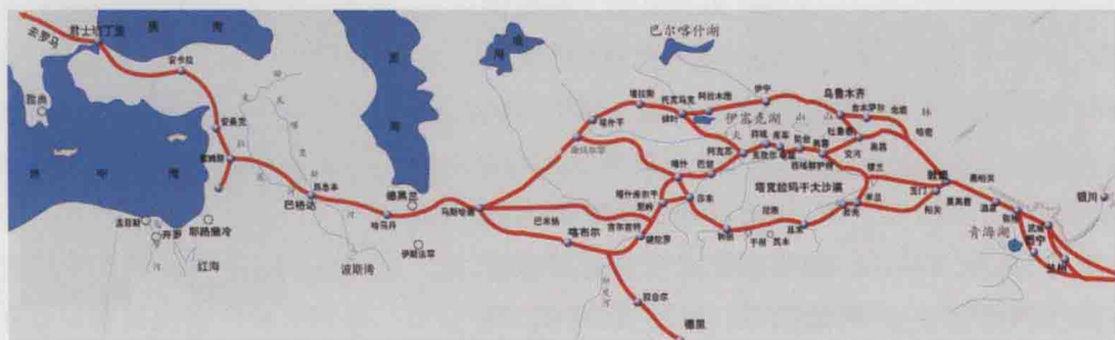
图 1 丝绸之路示意图