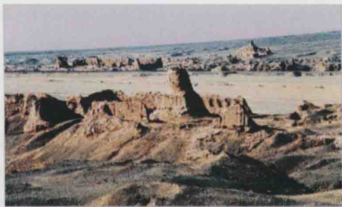
图6 苏巴什佛寺遗址 唐代(7~10世纪)库车县

来看,印度佛教文化中具有古希腊艺术风格的犍陀罗艺术大量涌进西域。1906年12月,斯坦因在米兰故城遗址考察挖掘的“有翼天使”壁画,就是较早的例证。其中在塔里木盆地南缘的于阗等地也有印度笈多艺术样式的影子。当然,新疆的佛教文化艺术并非被动地接受来自东西方文化的影响,而是在选择中