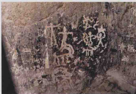
图1 皮山桑株岩画：狩猎图

20世纪50年代，在塔里木盆地南缘的皮山县发现桑株岩画 [3] (图1)。其后，在准噶尔盆地西北的天山山麓也发现了岩画(图2)。