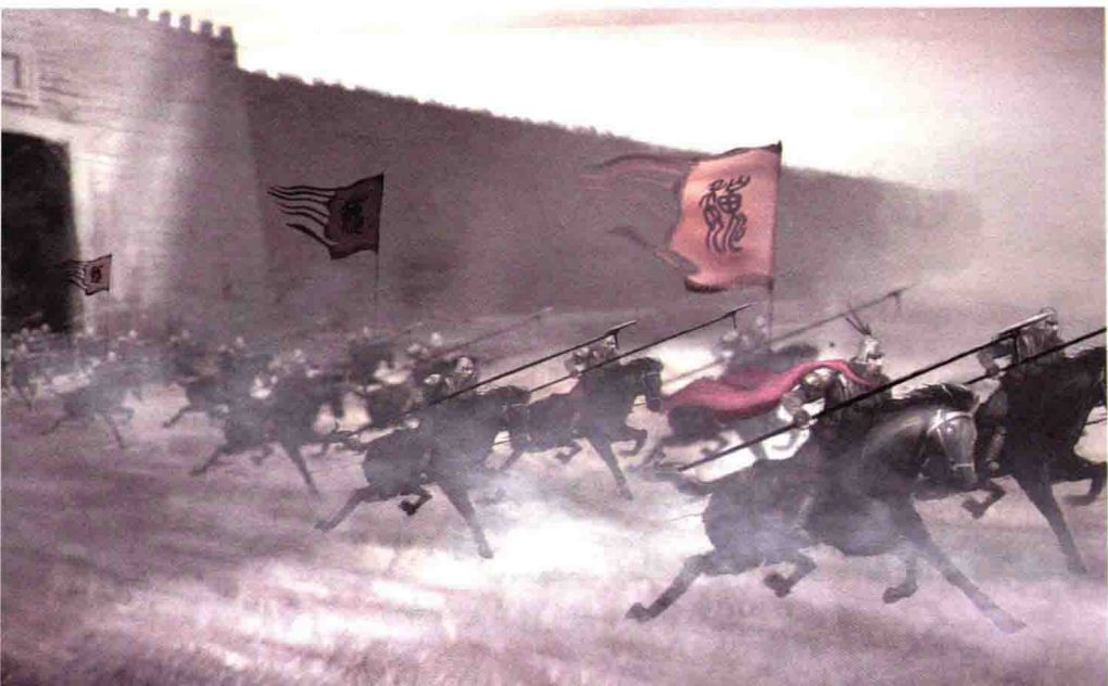
黎明时分，张辽出城向吴军发动袭击