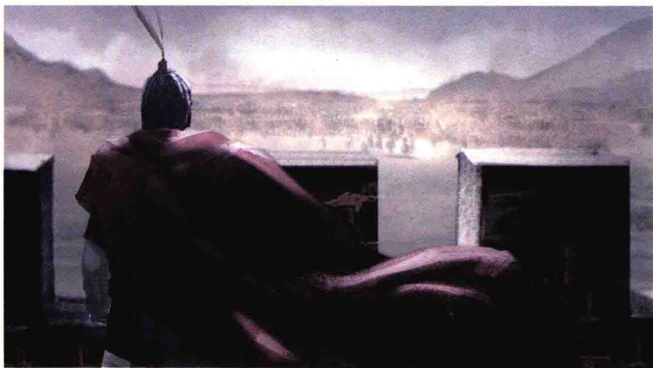
孙权大军兵临合肥城下

215年，东汉末，赤壁之战已经过去了七个年头。七年之前，在长江江面漫天的火光之中，曹操所谓的八十万大军被孙刘联军合力击败，叱咤中原的一世枭雄败走华容道，被迫退回长江以北，与孙权划江而治。赤壁之战后，三国鼎立的局势浮出水面，但是曹操却并没有放弃一统中华的大愿。