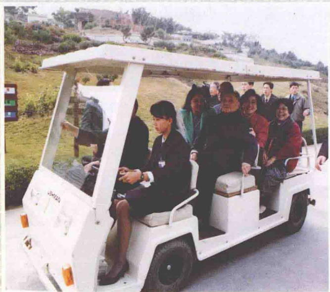
鄧小平同志在深圳錦綉中華（1992年1月）