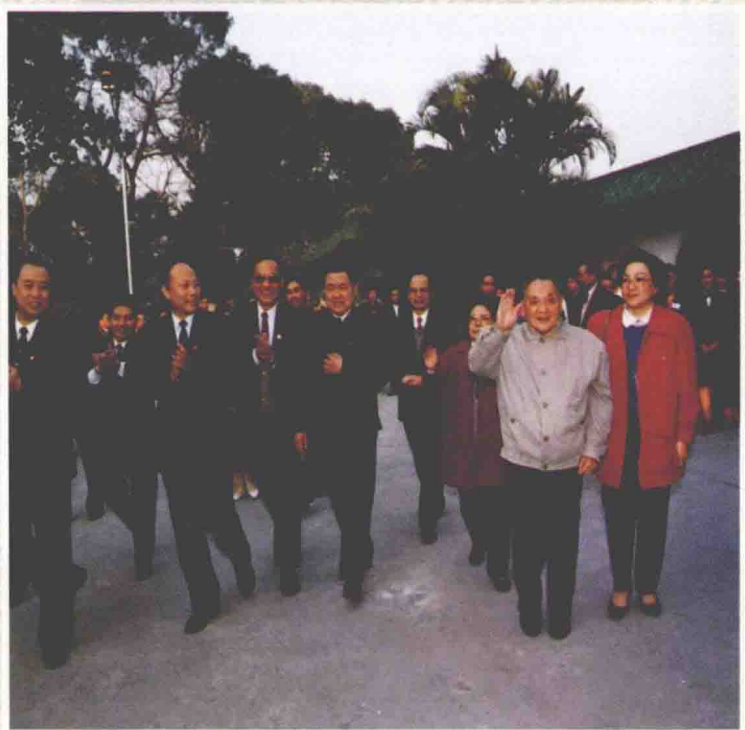
鄧小平同志1992年1月在深圳和廣東省、深圳市領導人謝非、李灝、鄭良玉、厲有為等在一起。