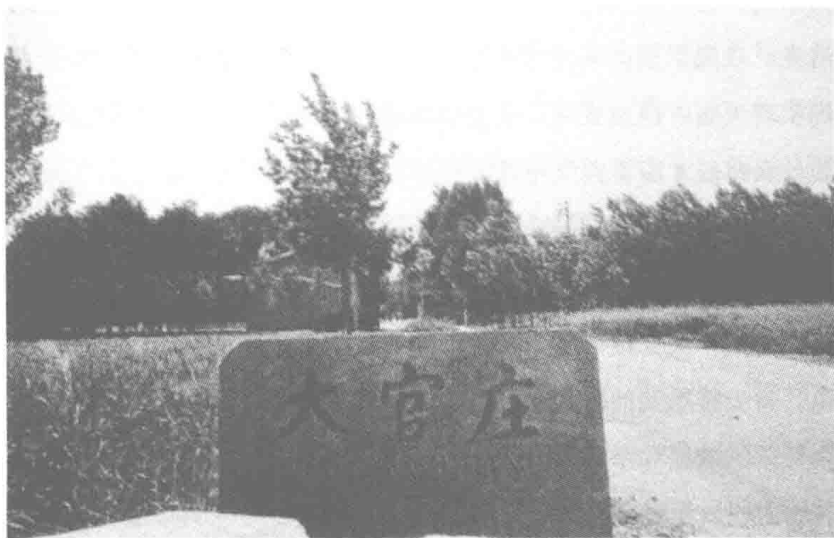
季羨林先生故乡——山东临清大官庄

我的心，虽然像黄土一样地黄，却不能像黄土一样地安定。我被圈在这样一个小的天井里：天井的四周都栽满了树。榆树最多，也有桃树和梨树。每棵树上都有母亲亲自砍伐的痕迹。在给烟熏黑了的小厨房里，还有母亲没死前吃剩的半个茄子，半棵葱。吃饭用