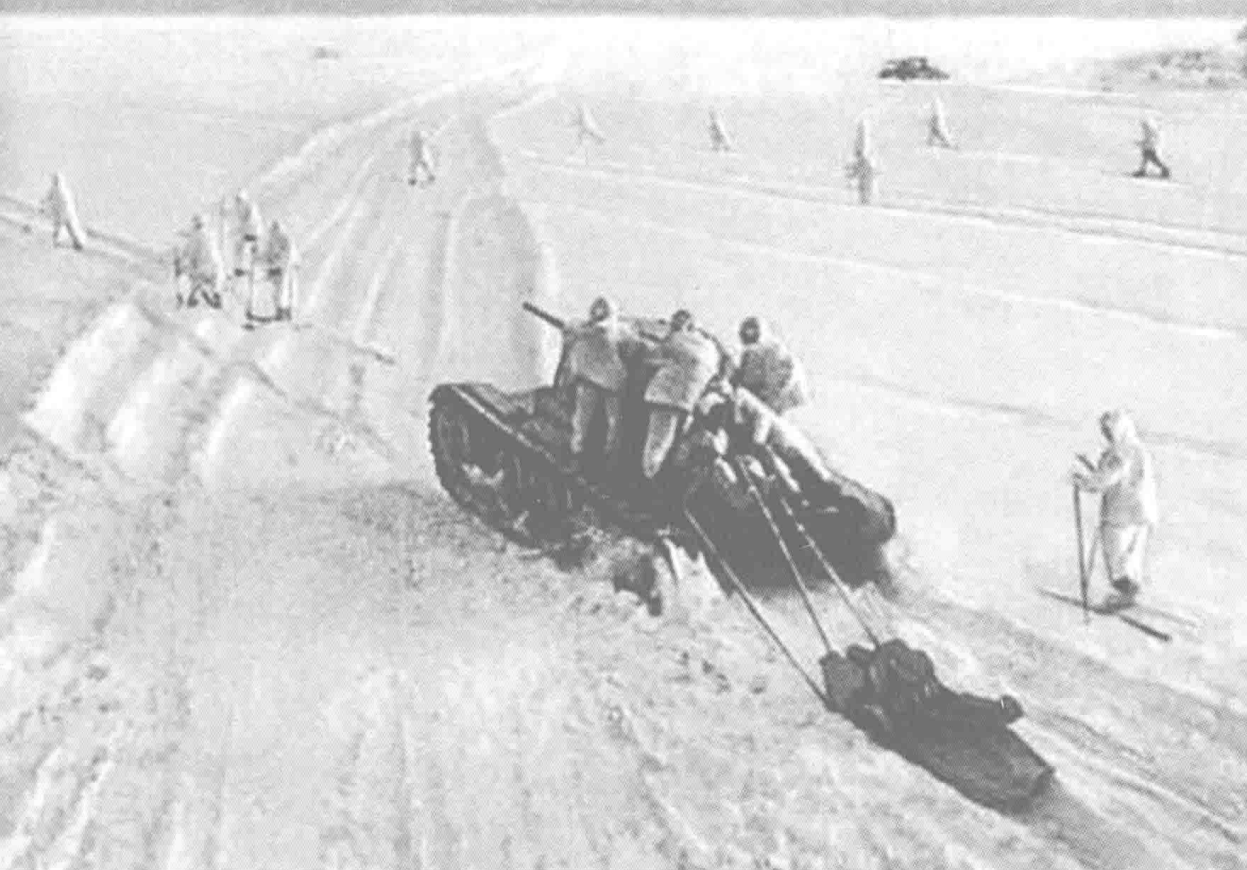
1941年12月的反攻战役中，苏军滑雪部队与坦克部队协同作战

这时的希特勒，才终于意识到了自己已经完全陷入了进退维谷的困境之中，12月16日，他对仍在冰天雪地中的德军士兵下达了“坚守阵线，以防撤退引起大溃败”的指令。这一指令显然与德军战地司令官希望得到的指令背道而驰。可固执的希特勒根本听不进去任何的反对意见。凡是对这一指令稍有异议的将军都被免除了军职——12月17日，以健康状况不佳为借口，博克在 frontline 被就地免职，由陆军元帅京特·冯·克鲁格接任；12月19日，瓦尔特·冯·勃劳希契陆军元帅被免除总司令的职务，由希特勒兼任；在此后的4个星期内，当中央集团军群的命运仍然悬而未决时，希特勒于12月25日免除了古德里安的第2装甲集群司令的职务，接着又分别免除了第4装甲集群和第9集团军的司令霍普纳和施特劳斯的职务。最后这位一不做二不休的独裁者索性自己当上了陆军总司令，亲自指挥战局。