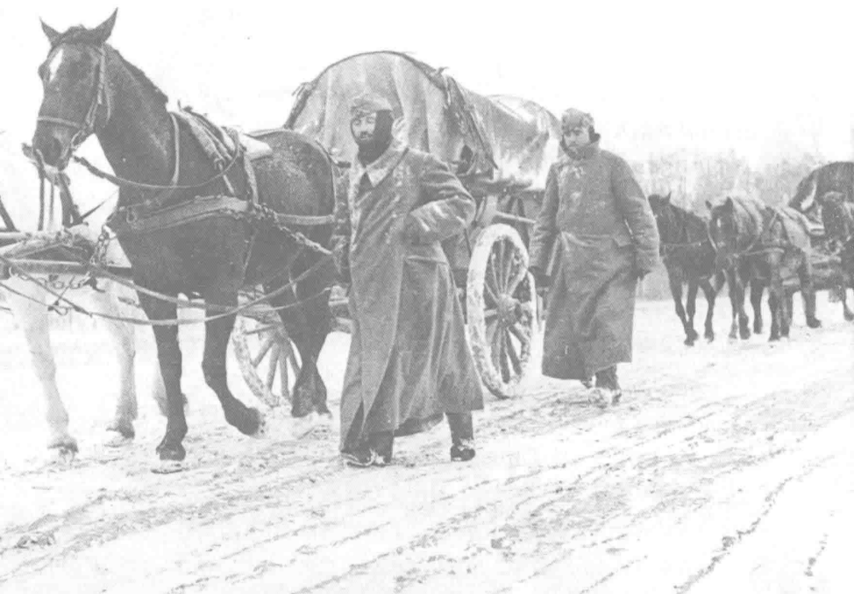
❶ 1941年冬，莫斯科的严寒让德军的补给队伍步履蹒跚，图为德军的补给部队使用马车替代机械化部队运输物资