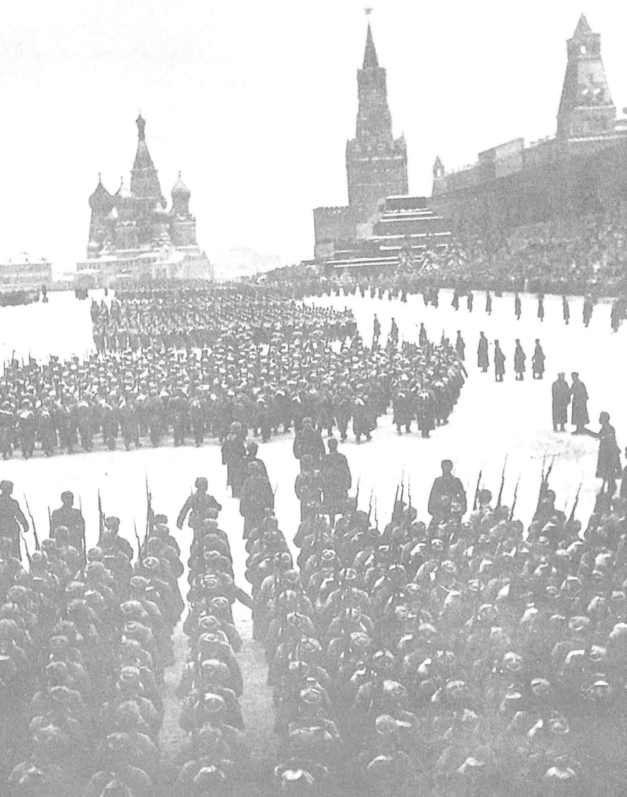
1919年11月7日，苏联正处亡国家、民族生死存亡的关键时刻，为鼓舞士气、庆祝十月革命胜利24周年，红军在莫斯科红场举行了盛大的阅兵式，斯大林发表了《检阅红军的演说》，充满激情的演说同成了重要的战争动员令。阅兵式一结束，受阅部队直接开赴前线。这次阅兵极大地鼓舞了苏联人民的战斗意志。